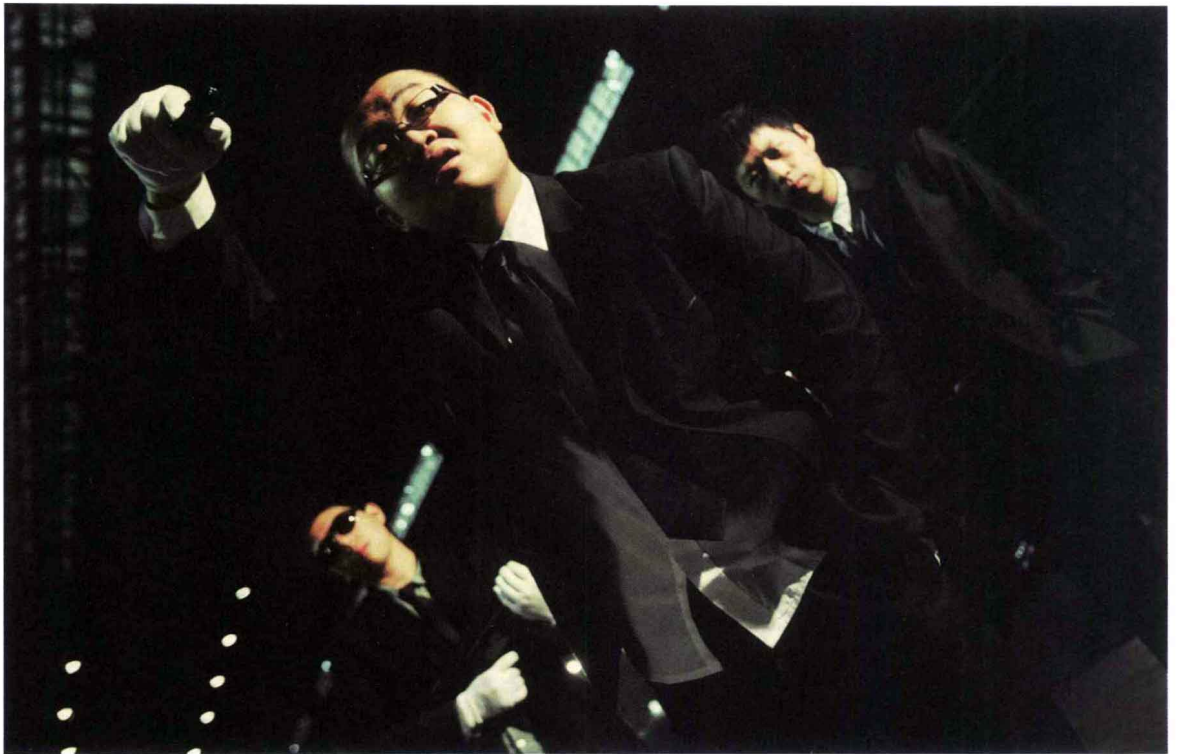
图 A1-1a 作品标题：围猎 作者：汪大千 摄影系 2009 级本科班 指导老师：林韬