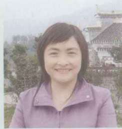
学术委员会副主席： 三峡大学长江三峡 发展研究院教授