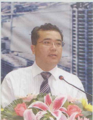
顾问:广西旅游局 陈建军局长