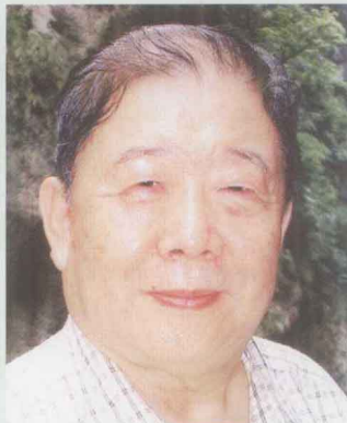
顾问:著名人类学家 乔健教授