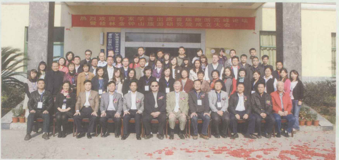
首届旅游高峰论坛与会学者合影