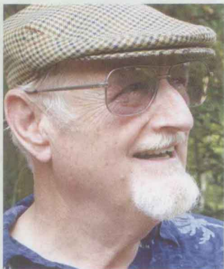
顾问:美国伯克利加州大学 格拉本(Nelson, H.H.GRABURN) 教授