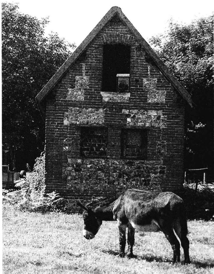
康克斯区的一座小建筑

一样在仕途中晋升,或限制他们将来从事什么职业。父亲丰厚的薪水给孩子们的成长提供了有利条件。后来,他的六个孩子中有四个从事艺术职业,而且都获得了成功,这都要得益于家庭给予的经济支持和情感上的理解。欧建·杜尚曾经对他的孩子们说:“你们要做艺术家可以,我尊重你们的选择,而且可以继续供给你们生活费,但是我一共有六个孩子,为了把事情做得公平,将来你们分遗产的时候,我把在你们成年之后供给你们的生活费从遗产中扣除。” ① 欧建采取这样一种理智、清晰计算的方式,处理每个孩子的培养费用问