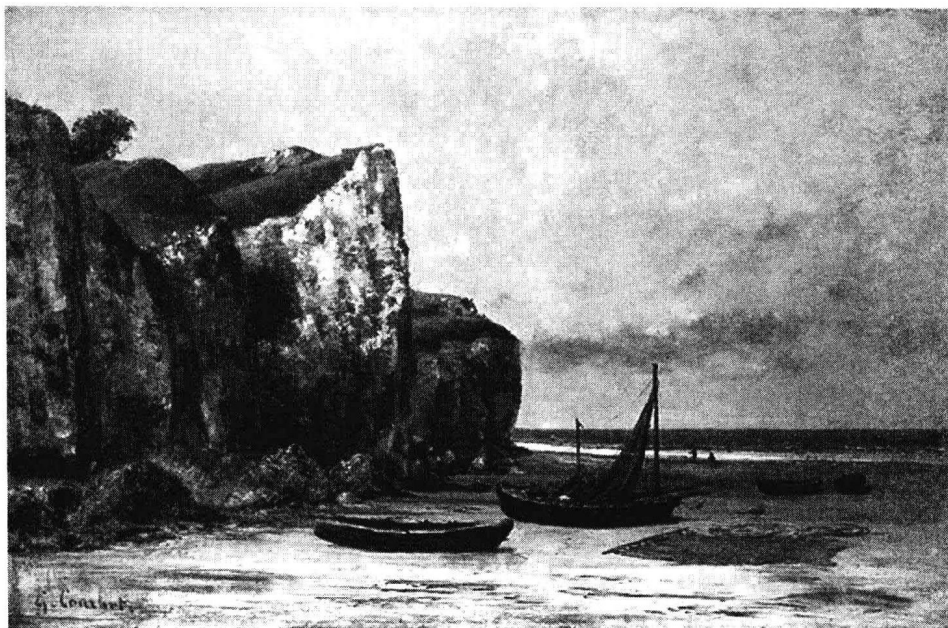
古斯塔夫·库尔贝:《诺曼底海滨》( Plage de Normandie ), 油画, 1872/1875 年

villa”,意思是“布德瓦之家”(home of Beaudoin),在百年战争时期曾是军事要地。1820年,圣-阿尔努(St-Arnoult)村和格列沃恩村并入到布兰维尔村就形成了现在的布兰维尔-格列沃恩。这是一个有着浓郁的艺术气息和文化氛围的乡村。每年一度的“古爵士”(Archeo-Jazz)音乐节都会于当年六月底在中世纪的城堡遗址中上演。