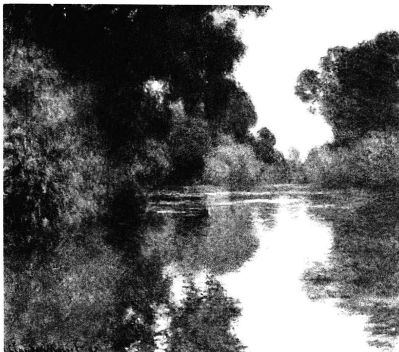
莫奈:《吉维尼附近的塞纳河支流》( Branch of the Seine near Giverny ), 油画, 1897 年

高高的泥墙,四周也种上防护林。站在农场中望着远处排排的山毛榉,让人领略到“绿树村边合”的妙趣。