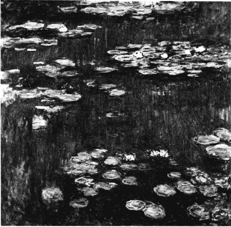
莫奈:《睡莲》(Water Lilies), 油画, 1916年

南部的河港发展了与卢昂(Rouen)和巴黎的河上贸易,这里的居民以渔业、种植和编织亚麻为传统行业。得天独厚的自然条件加上康克斯人的勤劳,使这里处处呈现出一派生机勃勃的景象。尤其是康克斯区迷人的滨海白垩高原风貌,它独特的形态与色泽赢得了不少文人墨客的圈点,在福楼拜(Gustave Flaubert, 1821-1880)和莫泊桑(Guy de Maupassant, 1850-1893)等人的文学作品中多有出现。大自然的鬼斧神工造就的地理容貌更是吸引了许多艺术家前来游览创作,如法国现实主义画家古斯塔夫·库尔贝(Gustave Courbet, 1819-1877)和印象派画家莫奈等,在画面上再现康克斯的美丽容颜。