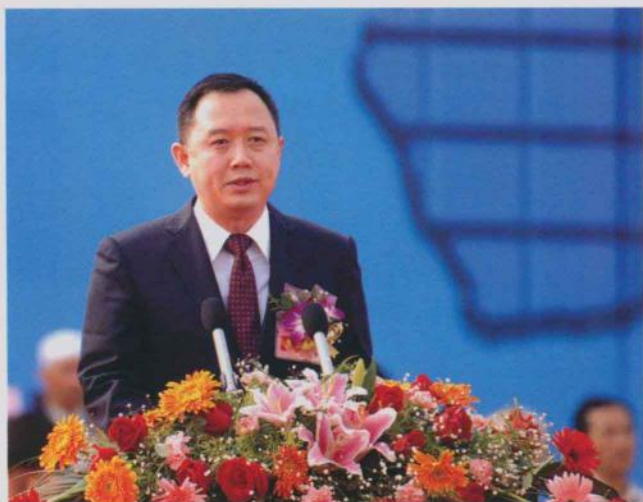
中共玉林市委书记、市人大常委会主任 金湘军