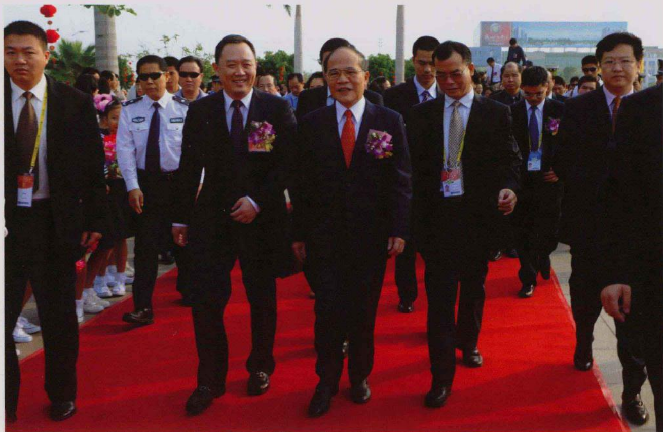
越南国家常务副总理阮生雄(前左三)率团参加第六届玉博会