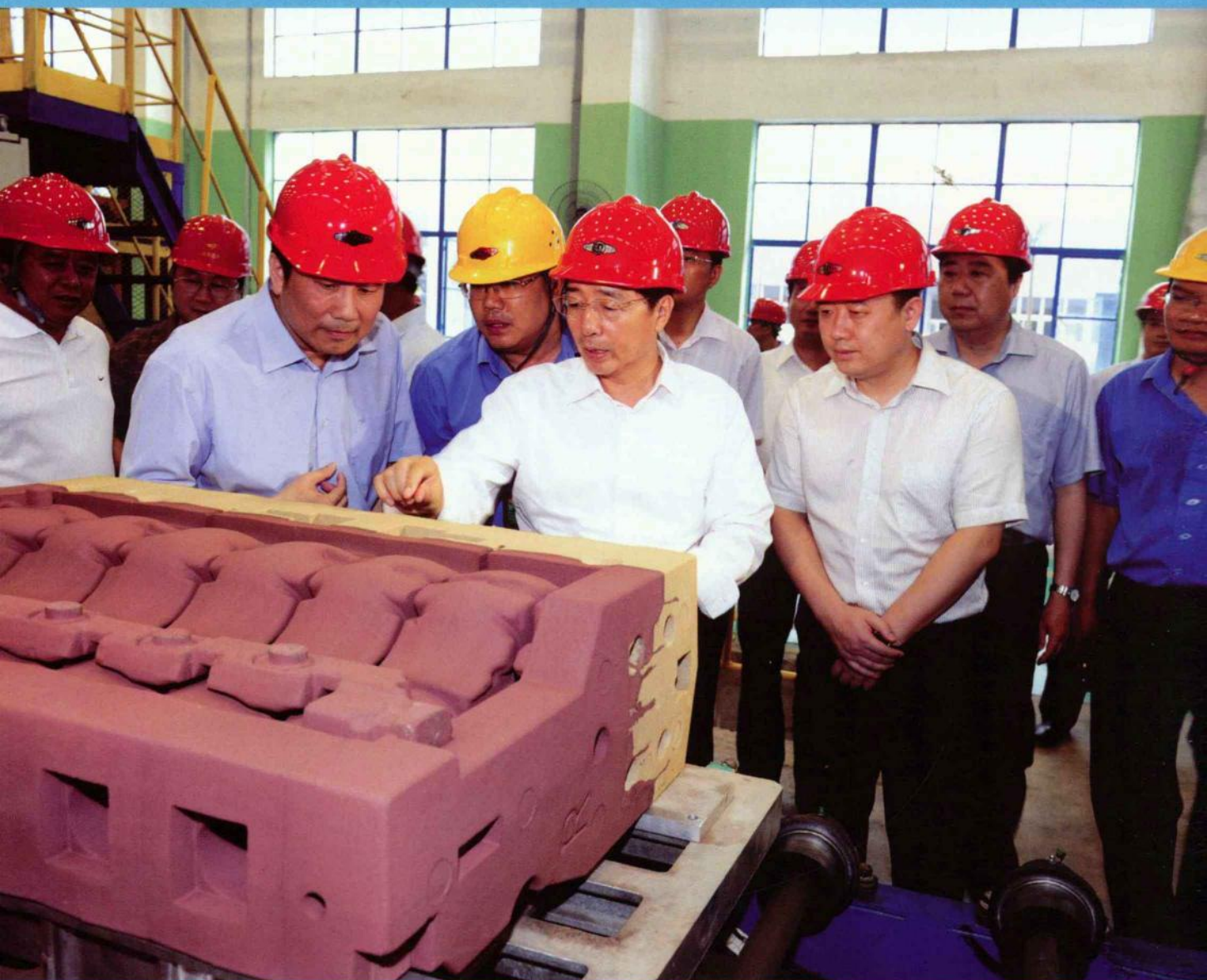
广西壮族自治区党委书记、自治区人大常委会主任郭声琨（前中）到玉林考察经济社会发展情况和深入玉博会签约项目——玉柴铸造中心生产车间考察调研。

“中小企业大经济，玉林博览新商机”。在自治区党委和政府的亲切关怀下，玉林市已成功地举办了6届玉博会，2010年第七届玉博会也即将闪亮登场。由于不断强化精品意识，突出地方特色，因此在规模、档次和规格上一届比一届高，品牌含金量年年递增，吸引的国际元素日益增多，已经成为一个在国内外颇具影响力的区域性国际展览会，是玉林人民一年一度的盛大节日，也是广西仅次于中国—东盟博览会的盛会。