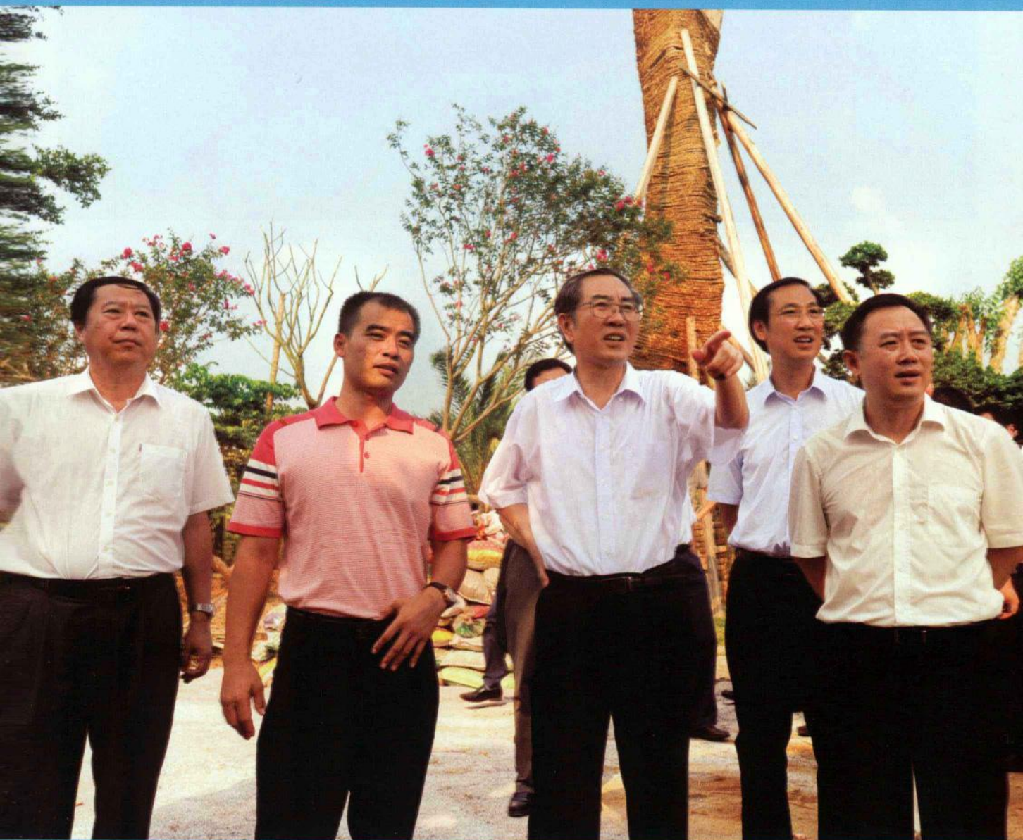
广西壮族自治区主席马飏（左三）到海峡两岸（广西玉林）农业合作试验区花卉基地玉博会签约项目——玉林市汉桂园园艺花木公司调研。