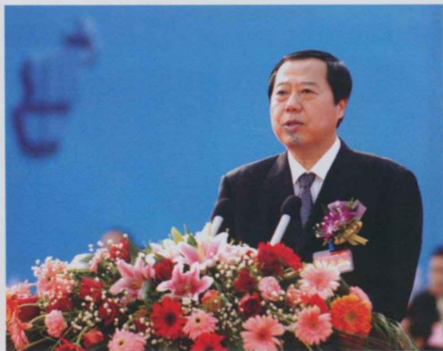
中共玉林市委副书记、玉林市市长 韩元利