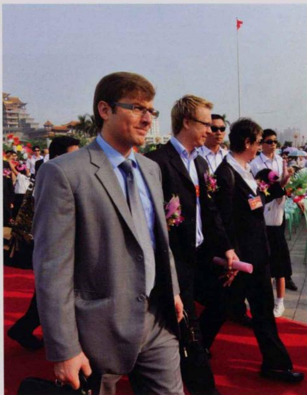
中外嘉宾参加第六届玉博会的情景