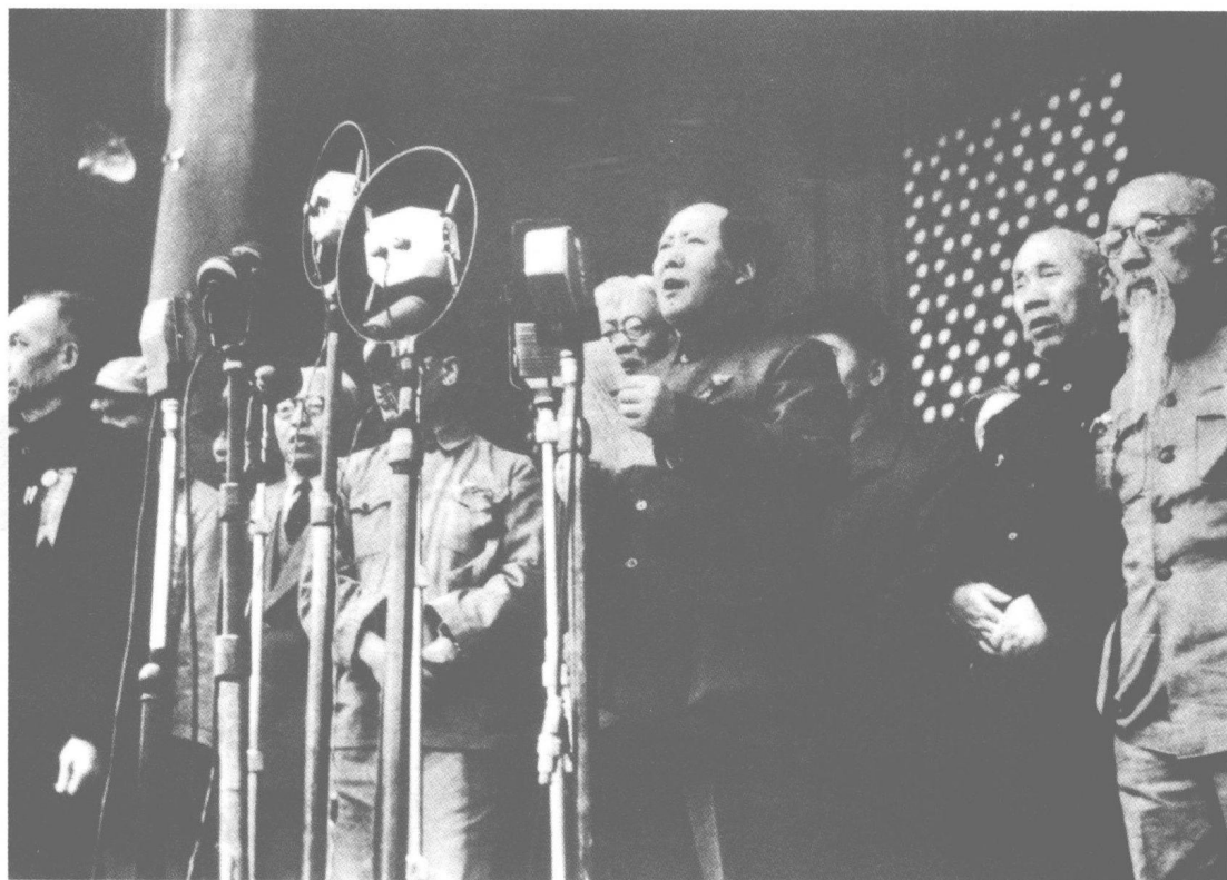
1949年10月1日，毛泽东在开国大典上宣读《中华人民共和国中央人民政府公告》。