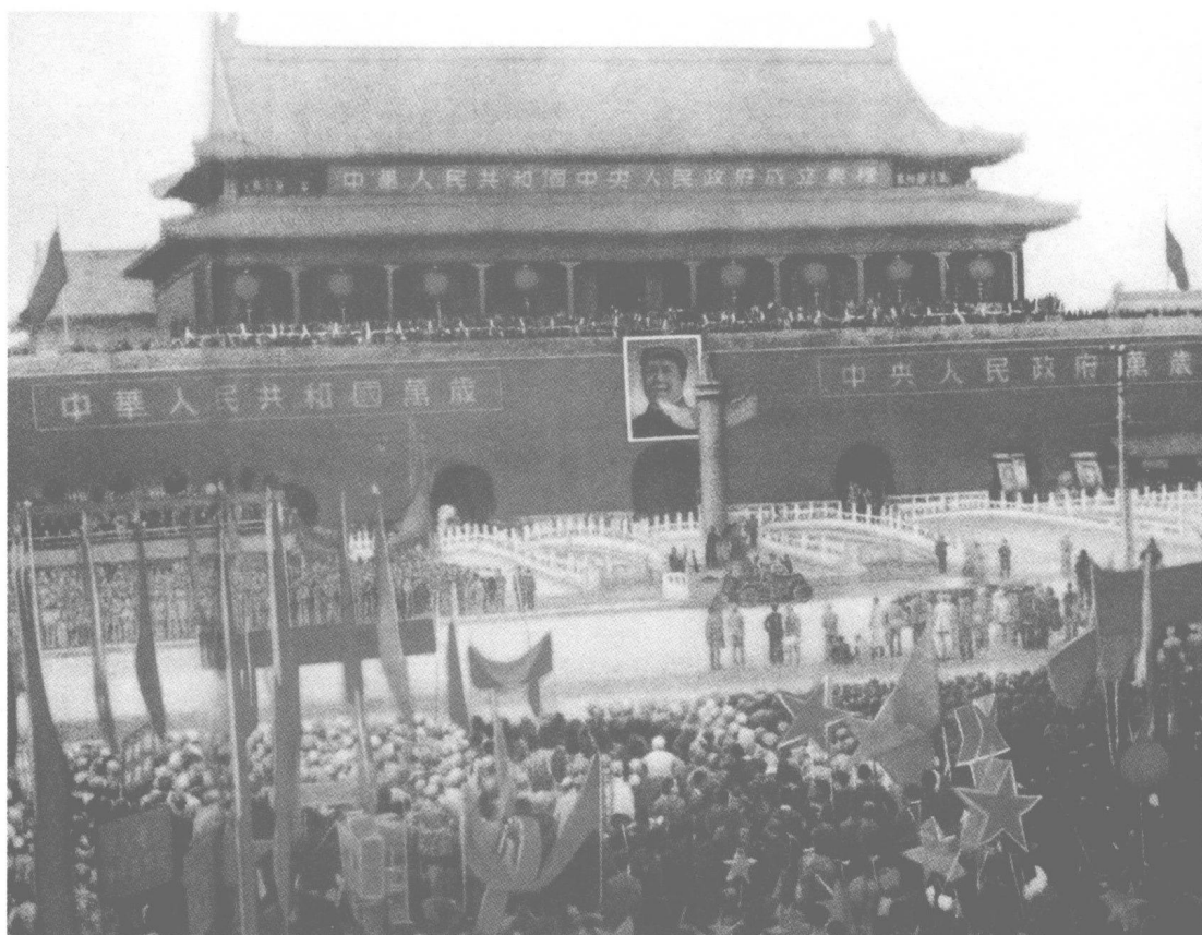
1949年10月1日，30万首都军民参加了开国大典。