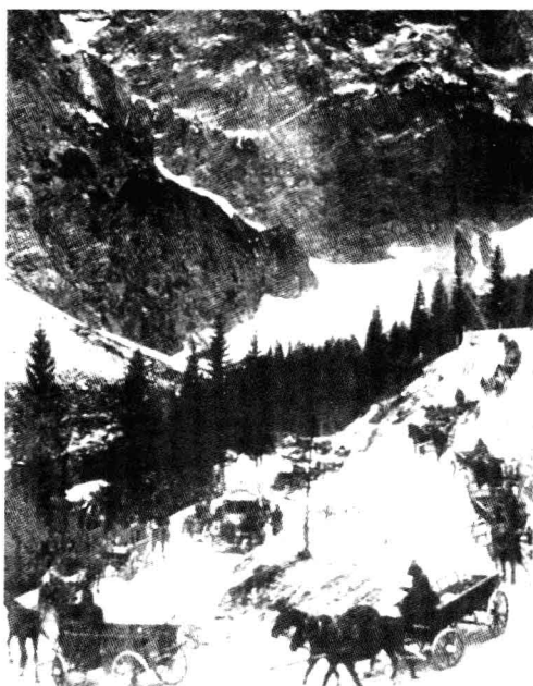
■ 一战时期的伊松索河前线。