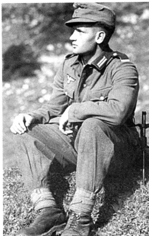
■ 山地部队的年轻士兵。

方的巴伐利亚和符滕堡地区以外，德国的边境地区基本上是平原地形。险峻的阿尔卑斯山脉远远地从中立的瑞士和友好的奥匈帝国内穿过。所以，直到1915年，德皇威廉二世才下令在巴伐利亚组建了德国的第一支山地部队，其成员都是来自巴伐利亚和符滕堡