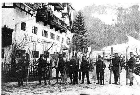
■ 皇家巴伐利亚第1滑雪营2连。