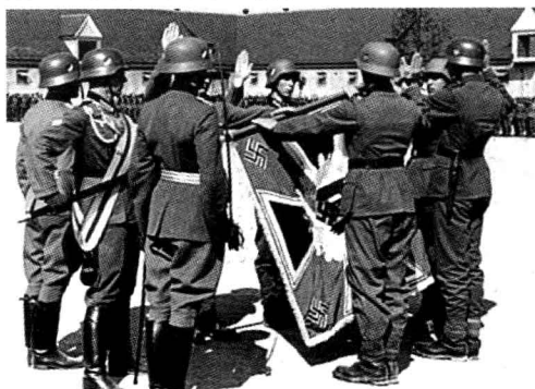
■ 山地部队的入伍宣誓仪式。图中的旗帜是步兵战旗。

南部山区作战经验丰富的老兵。该部队组成后，本计划投入到多山的巴尔干前线使用，但是却调到了法国和俄国。