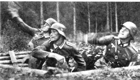
■ 最猛烈的战斗发生在利沃夫市郊外的壕堑阵地中。