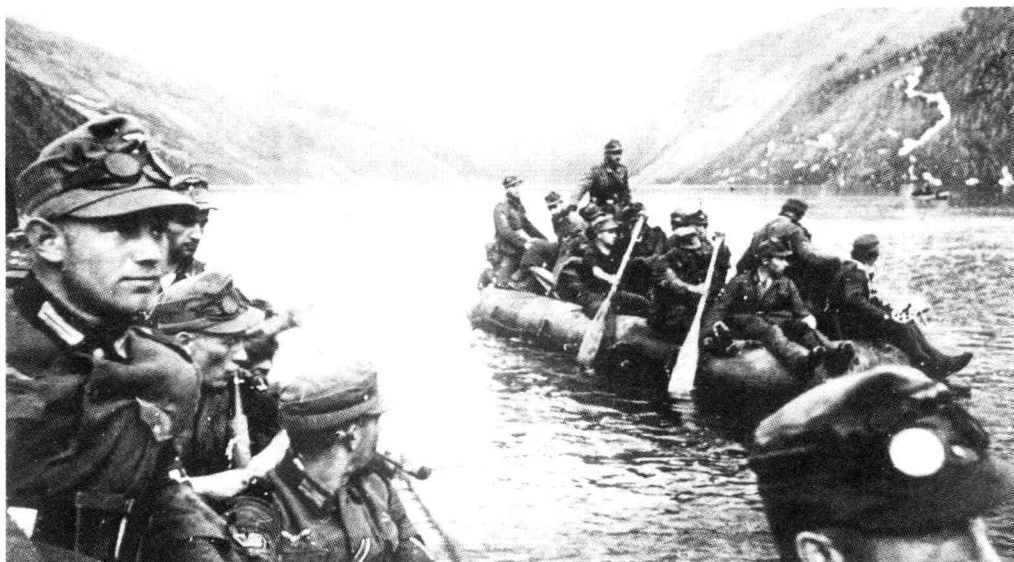
■ 峡湾中的山地步兵。德国将自己山地部队的2/3投入到挪威战役，但担任主要作战任务的是第3山地师。第2山地师主要从事支援任务。