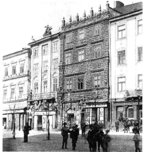
■ 战前的利沃夫市。该城原属奥匈帝国, 德文名为伦贝格 (Lemberg)。

赛条约, 开始重整军备。就在这一年, 德国陆军以保留下来的山地步兵骨干人员为基础, 组建了山地步兵旅, 辖有第98、99、100三个山地步兵团和第79山地炮兵团。