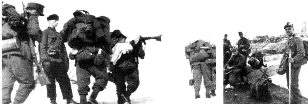
■ (左) 绕道瑞典边境前往纳尔维克的第137山地步兵团。(右) 准备空降支援纳尔维克守军的第1伞兵团。

但是，自从5月10日德军在西线对法国、荷兰、比利时和卢森堡发动总攻以来，挪威北部的战役就只是一种意义不大的军事行动了。法国和低地国家的战争更为重要，一切盟国的物资都优先供应那里。纳尔维克的英军缺乏船只，法军则缺乏士兵，挪威军队则面临说不出的苦楚——德国人已经被赶到瑞典边境，然而形势却不允许他们接受德国人