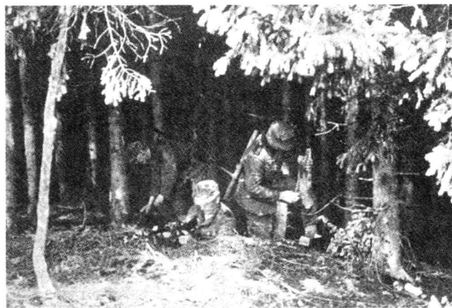
在波兰的森林中作战的第1山地师某机枪连。