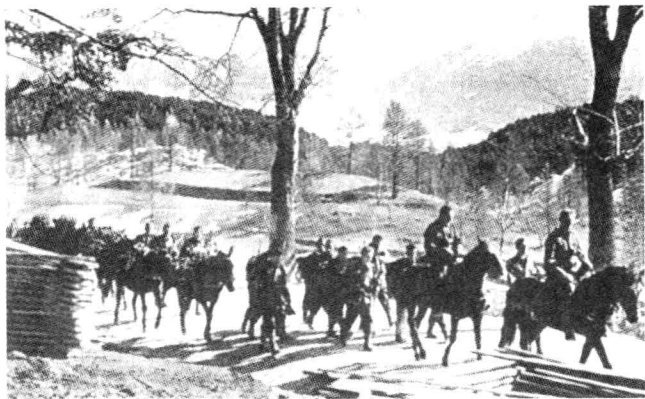
在风景如画的东喀尔巴阡山中行军的第1山地师。