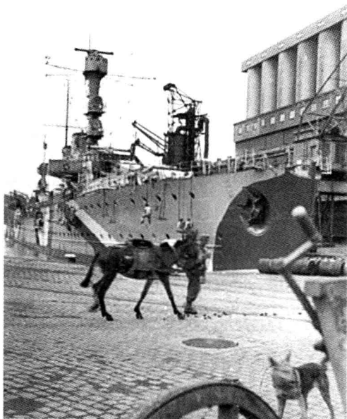
■ 停靠在奥斯陆码头的德国运输舰。

4月14日，英法联军在纳尔维克登陆。德军不仅在兵力和装备上居于双重劣势，还缺乏冬季需要的补给，撤到中立国瑞典的道路