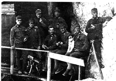
■ 1915年，奥匈帝国的山地部队。