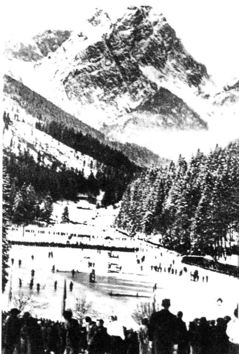
■ 1936年第4届冬奥会的盛况。

加米施和帕滕基兴位于巴伐利亚州的最南端，本是两个坐落在阿尔卑斯山中的小村庄和高山疗养地。这里的滑雪条件得天独厚，因此1936年的第4届冬季奥运会在这里举行。作为该年夏季柏林奥运会宣传活动的预演，希特勒和戈培尔也将冬奥会作为纳粹帝国对外宣传的一个窗口。奥运会结束后，该地许多优良的滑雪设施和旅馆被军方接收，作为陆军山地部队和滑雪部队的训练基地。1938年4月，加米施-帕滕基兴成为德国陆军新组建的第1山地步兵师的驻地。