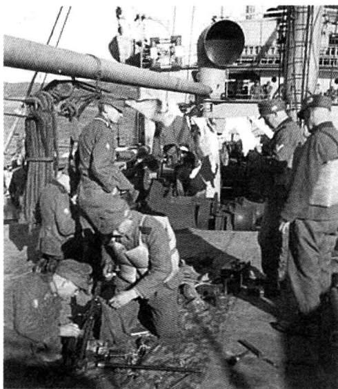
■ 登船前往挪威的第3山地师第137山地步兵团士兵。

然还是“静坐战争”阶段，但英德双方为了争夺北海和北大西洋的出入权，在挪威方向已经是大战在即。鉴于一战期间德国公海舰队被英国封锁在波罗的海之内的教训，德国海军一直把在下一场大战中控制北海和大西洋的海岸线作为最优先考虑的战略目标。在德国海军司令雷德尔的建议下，希特勒批准了入侵北欧国家的行动。德国人的目标是中立的挪威，同时路过丹麦。考虑到挪威的地形多为山地和峡湾，最高统帅部决定将第2和第3山地师投入挪威战线。