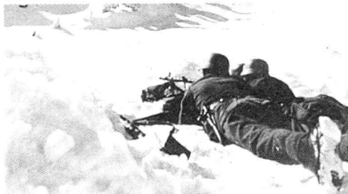
■ 雪地中的射击训练。使用的是MG34型机枪。