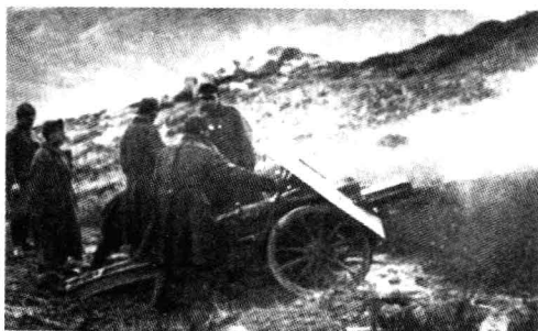
■ 奥匈帝国山地部队的炮兵。在伊松索河前线对峙的意奥双方在冬天经常用大炮互相轰击白雪皑皑的山峰，企图制造雪崩消灭对方。