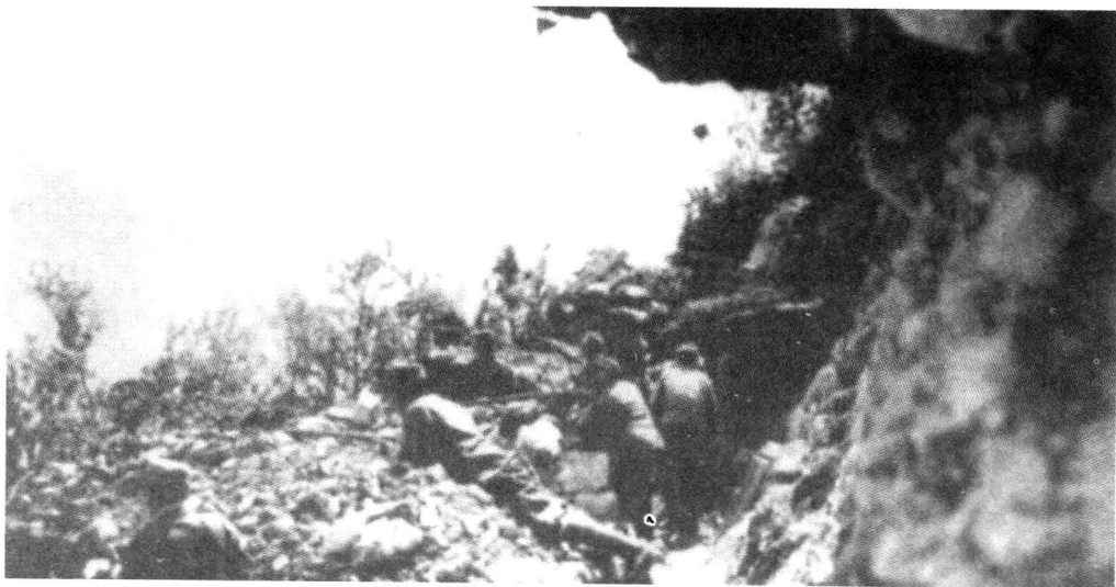
■ 一战中阿尔卑斯山前线的德国山地部队。