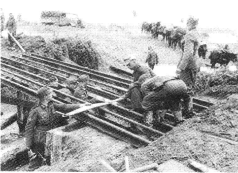
■ 正在波兰前线执行架桥任务的山地工兵, 限于师属工兵的装备, 在需要架设大型结构桥时, 必须由集团军提供支援。