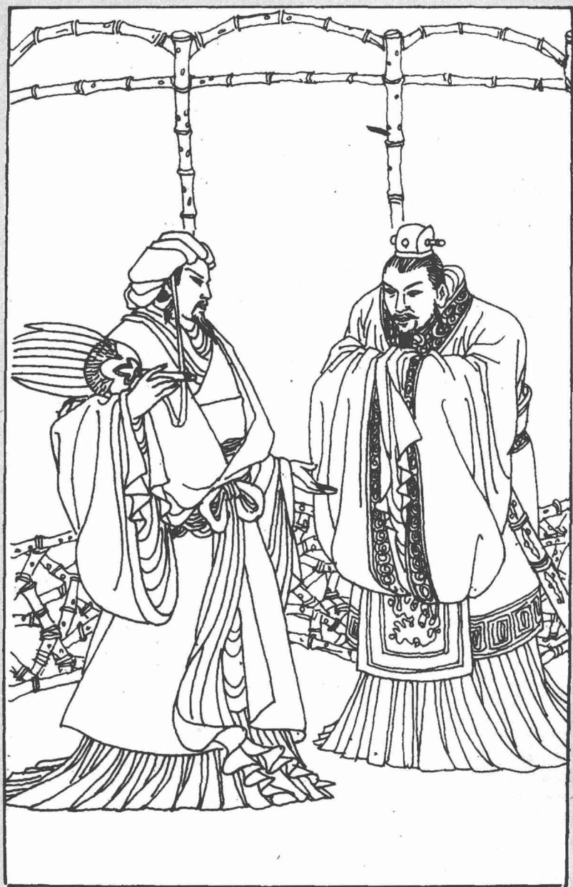
图一 刘备请卧龙出山