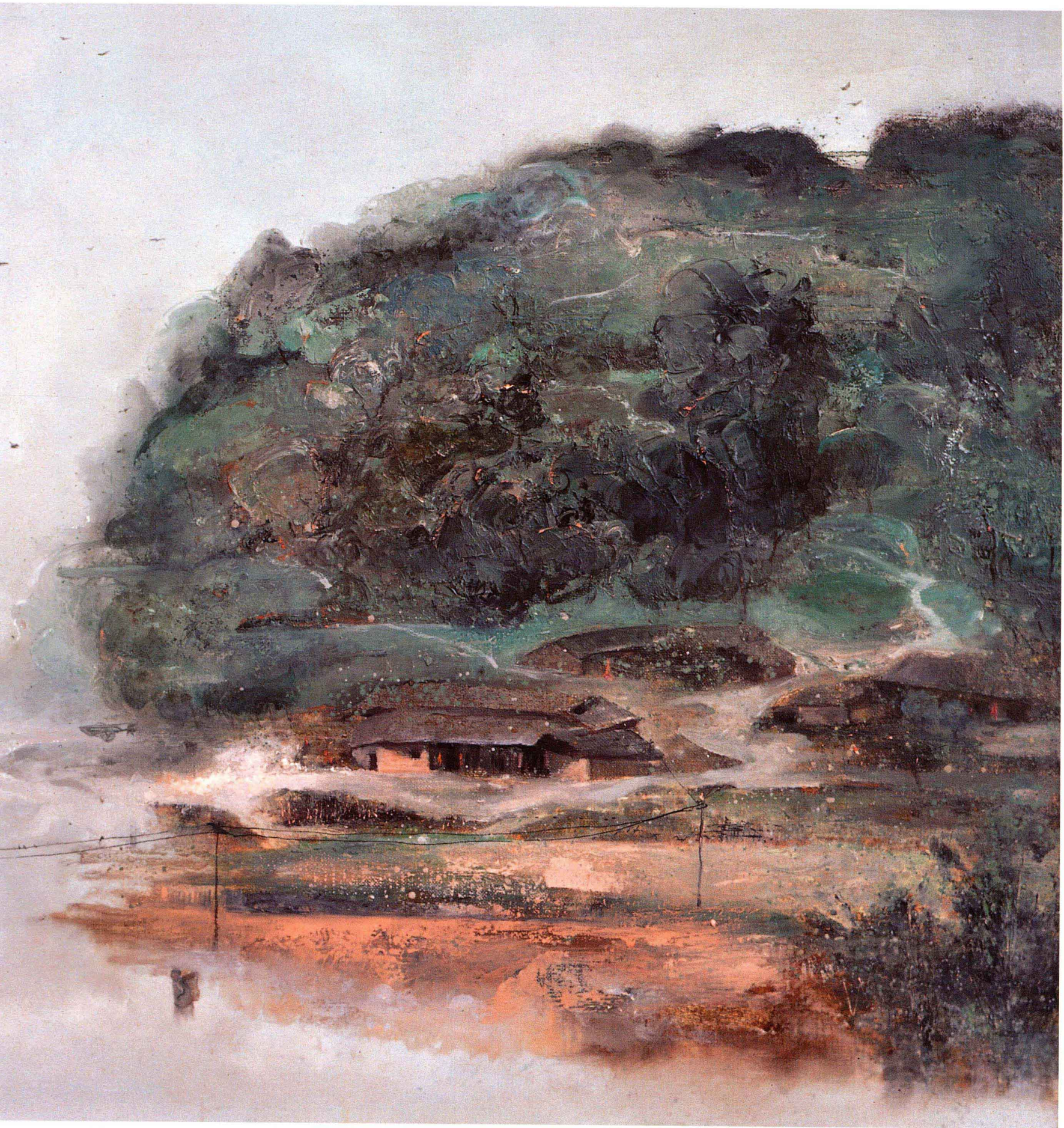
■ 相看两不厌 ■ 布面油画 Oil on canvas ■ 62cm x 120cm ■ 2011年