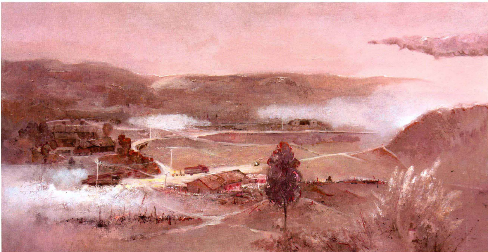
■ 齐天坪的南边 ■ 布面油画 Oil on canvas ■ 62cm×120cm ■ 2011年