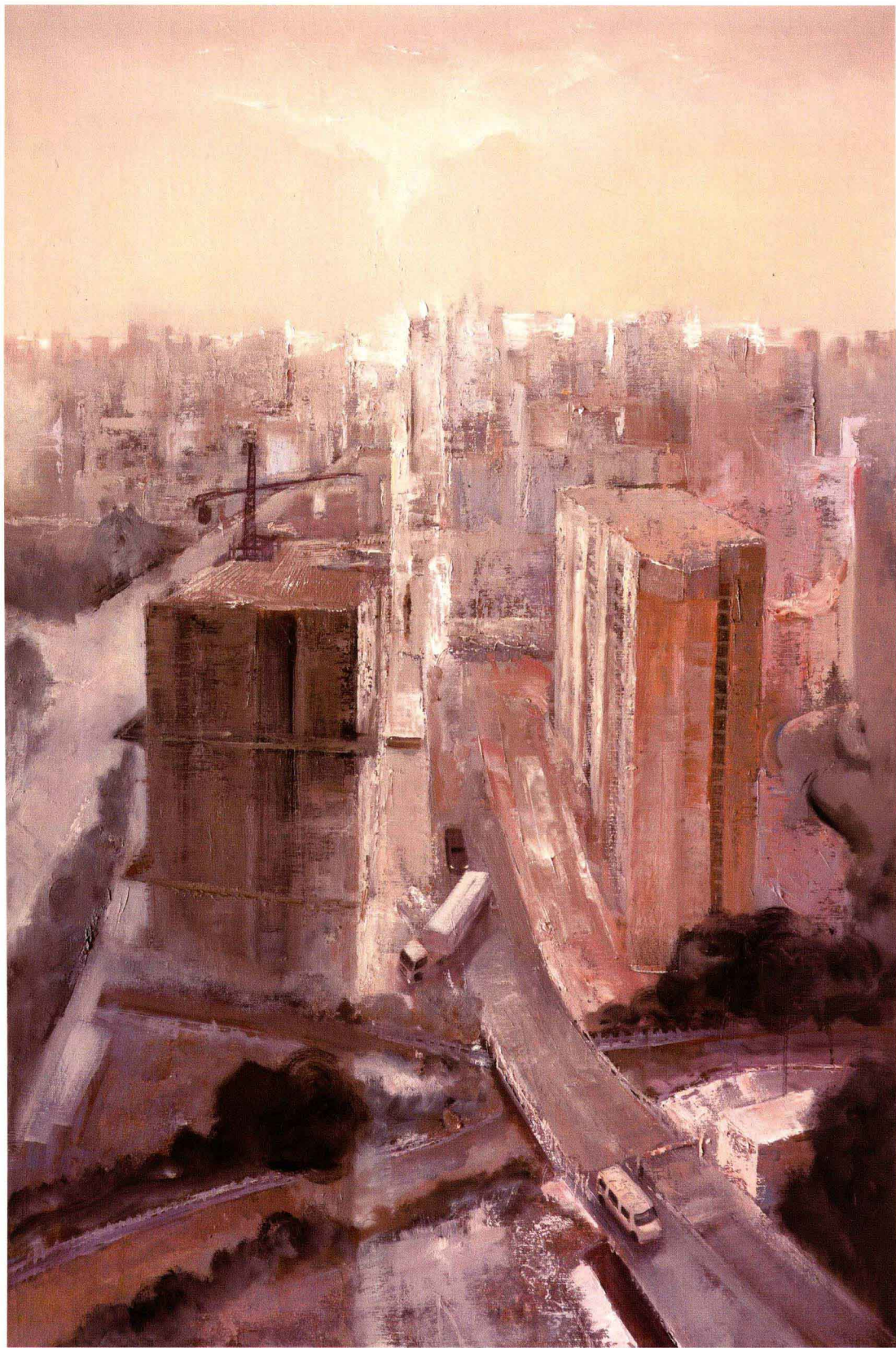
■ 侨基花园窗外的风景 ■ 布面油画 Oil on canvas ■ 120cm×80cm ■ 2011年