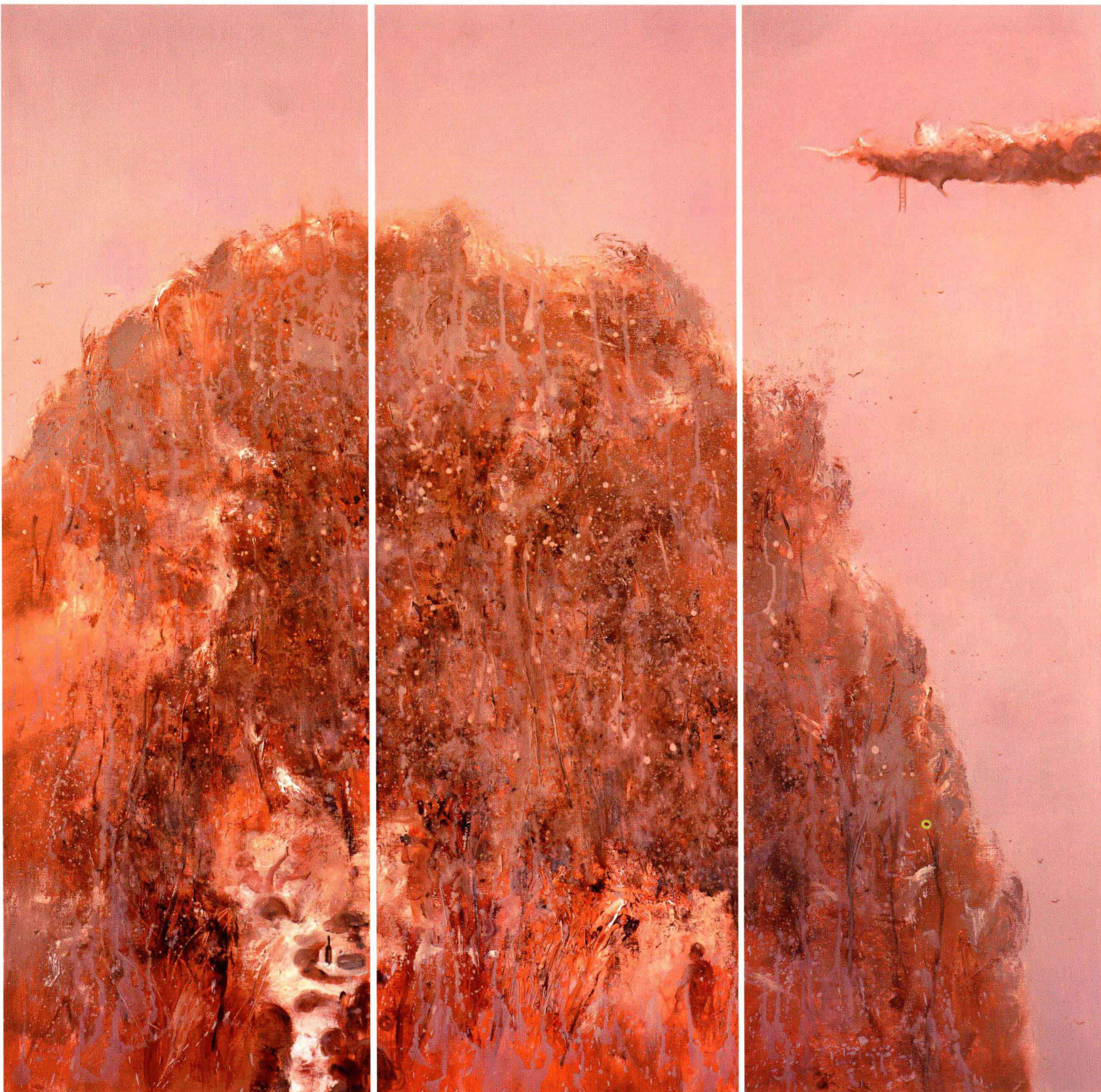
■ 狮子头的泉水在我心头 ■ 布面油画 Oil on canvas ■ 100cm×33cm×3联 ■ 2010年