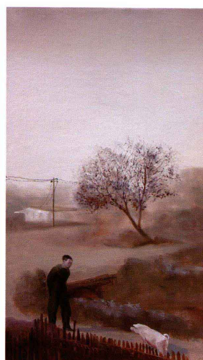
■ 四向桥的回忆 ■ 布面油画 Oil on canvas ■ 45cm×30cm×4联 ■ 2010年