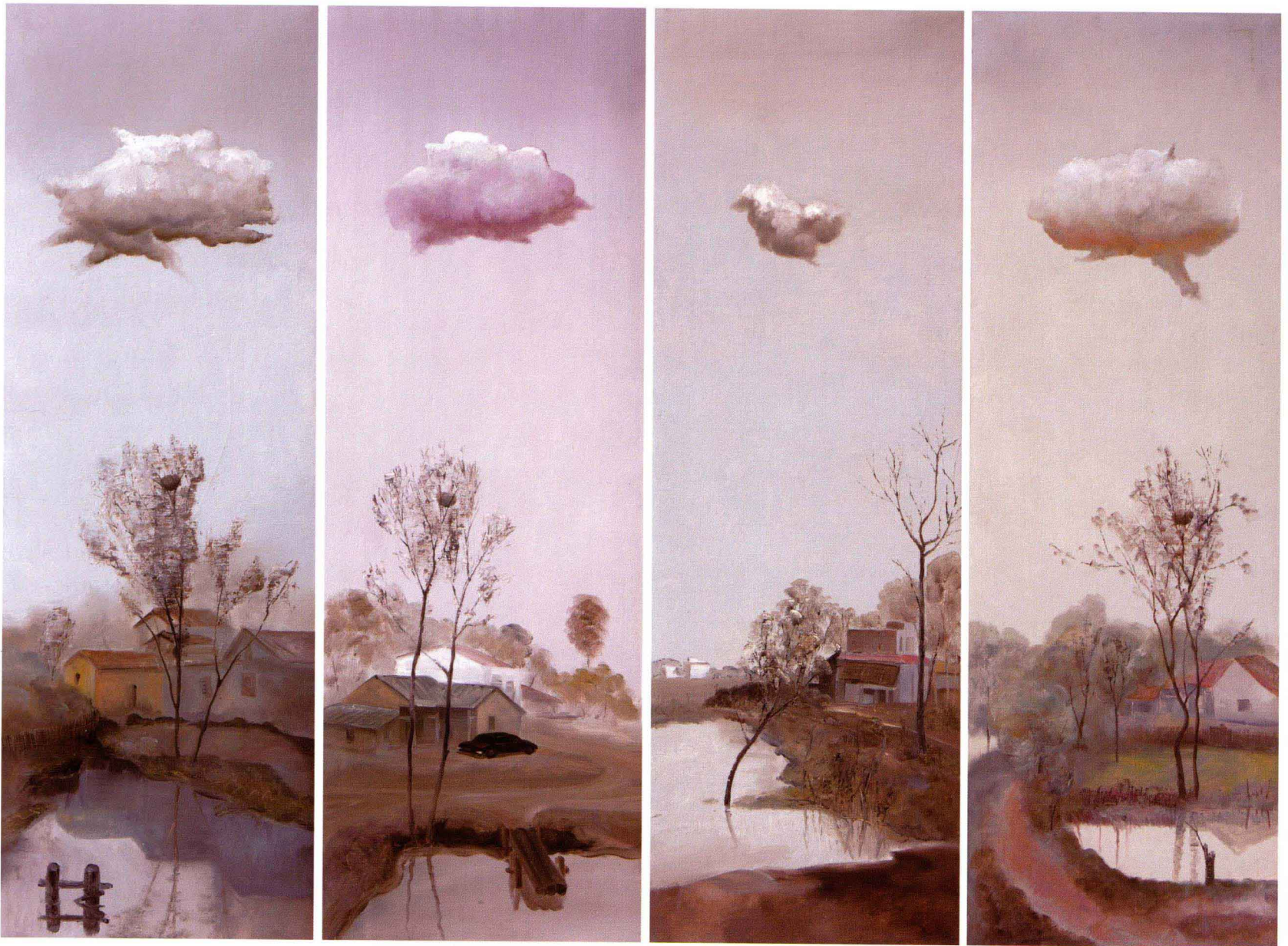
■ 云飘过 ■ 布面油画 Oil on canvas ■ 80cm×27cm×4联 ■ 2006年