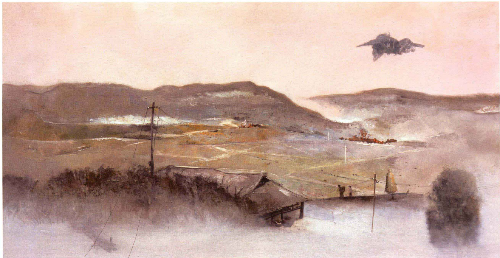
■ 齐天坪的东边 ■ 布面油画 Oil on canvas ■ 62cm×120cm ■ 2011年