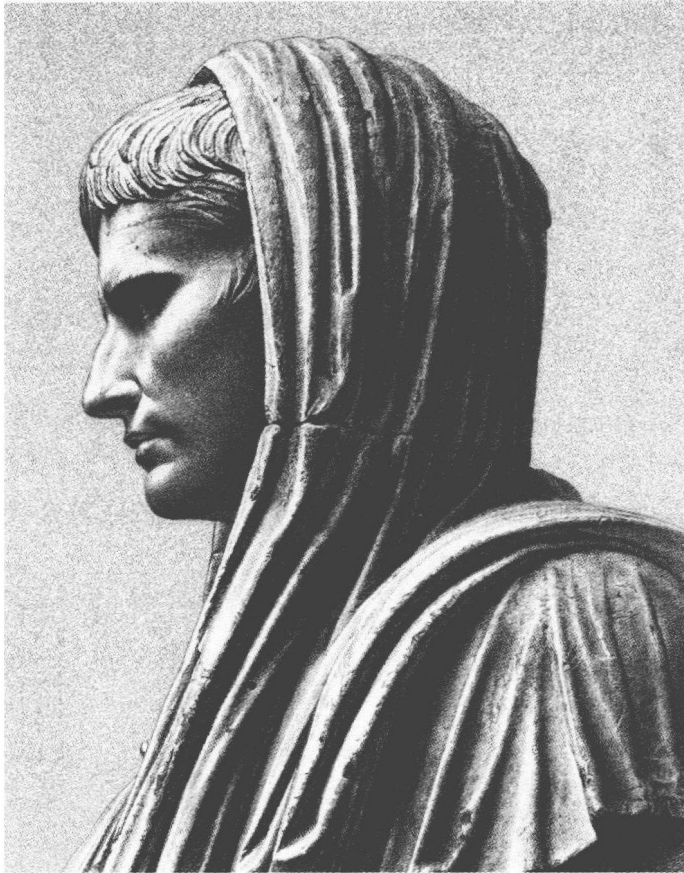
头披托加的大祭司奥古斯都