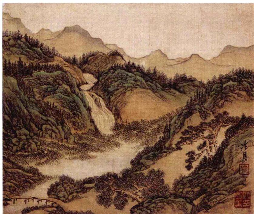
图1-2-2 著名画家陶冷月所作水山画