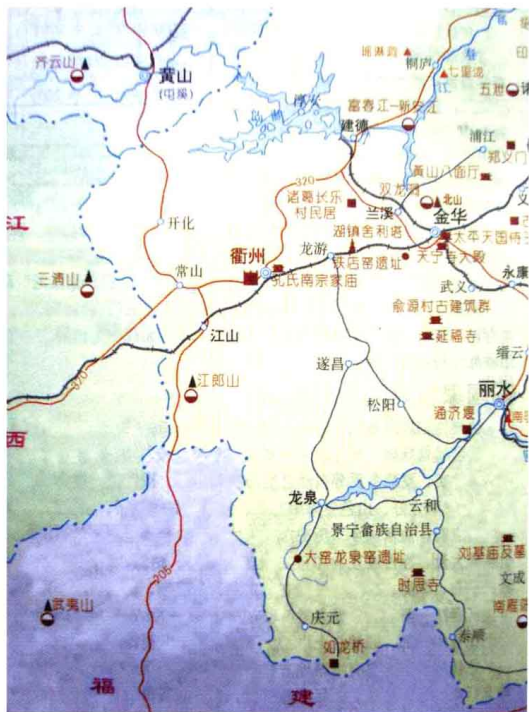
图1-1 大窑龙泉窑遗址方位图(据《中国文物旅游图集》)

历史文献中关于龙泉窑的地理位置有多处记载，明嘉靖辛酉(1561)印行的《浙江通志》记载：“龙泉县南七十里曰琉华山……山