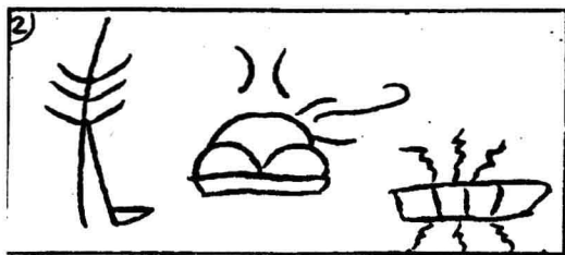
（傅懋勳《丽江么些象形文‘古事记’研究》P10） ③

准字符拆分成独立字符的能力指原始文字中的表意符号拆分成独立字符的能力。一般来说，成熟文字的字符比较独立，字符与字符的边界清楚。但原始文字中并不是所有字符的字符边界都很清晰，有的可以分出清晰的独立字符，但有的并不能分析出独立字符，我们将这种不能分析出独立字符的符号称之为准字符，准字符是以图形整体表义。原始文字中的准字符现象普遍。我们举一个东巴文的例子。