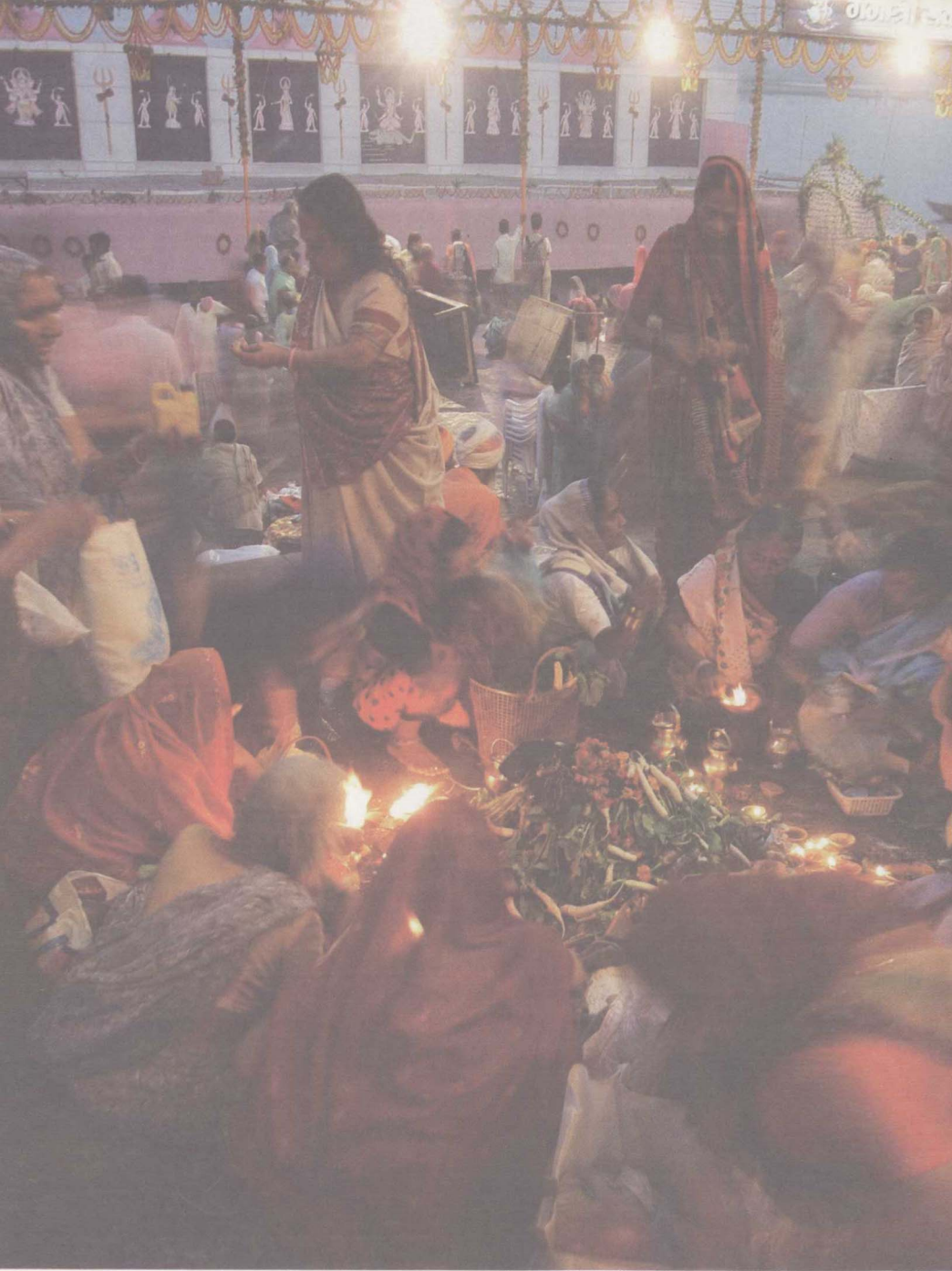
恒河边古老的祭河仪式