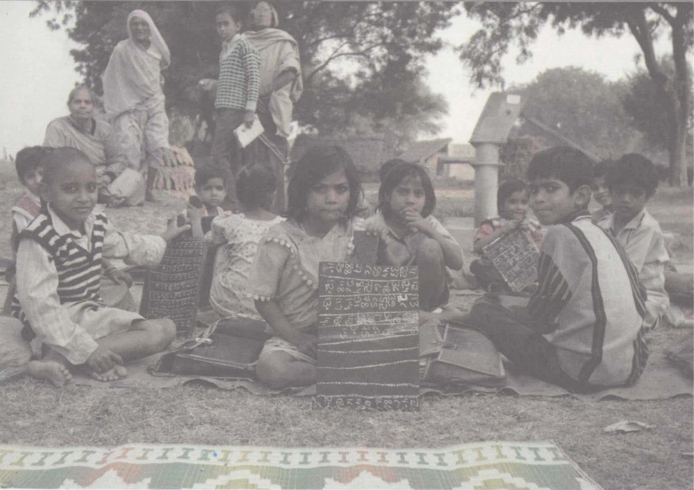
上 印度恒河流域的农村，妇女用头顶箩筐的方式运土 / 下 印度北部的乡村小学，孩子们在上課