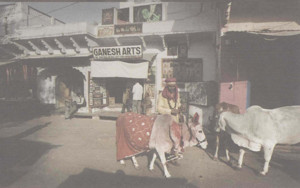
上 印度著名的“粉红之城”斋普尔 / 下 安详的印度小镇