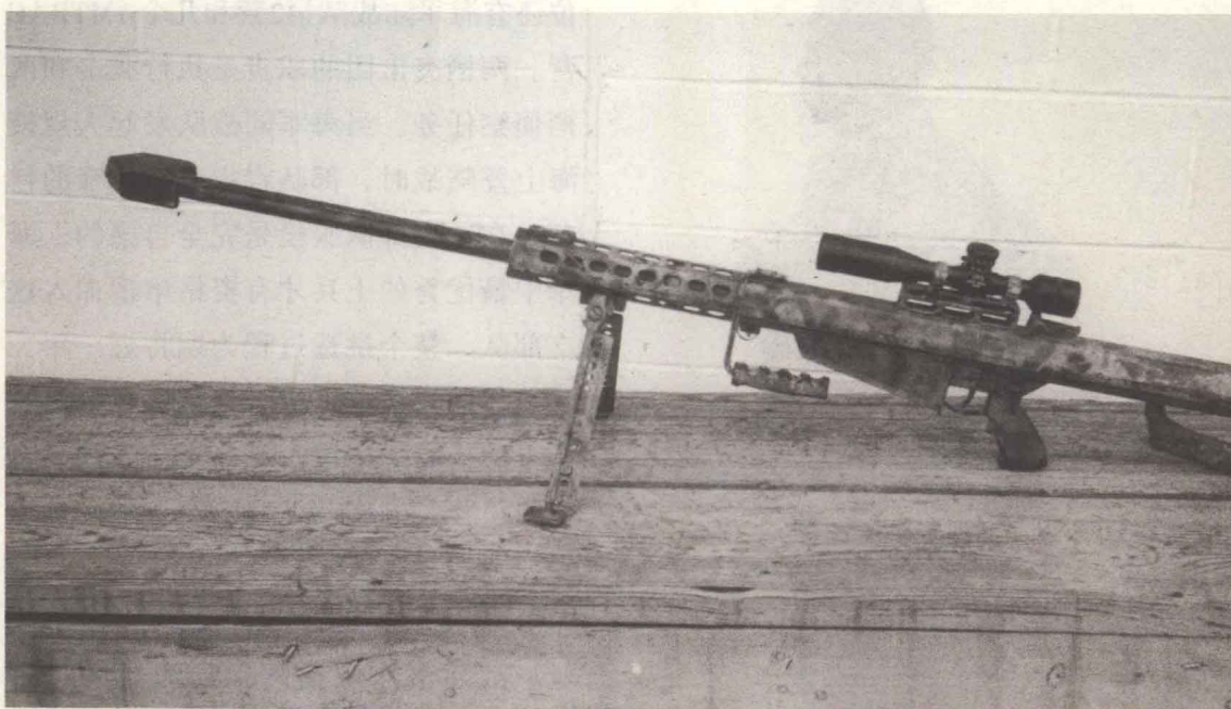
下图：巴雷特82型狙击步枪。

部队选用的武器则包括：格洛克8型匕首、格洛克18型9毫米自动手枪、勃朗宁HP35 9毫米手枪、带有两脚支架的巴雷特82型狙击步枪和HK 33E 5.56毫米步枪等。