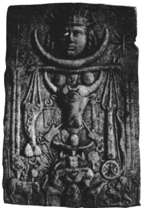
1. 献给救世主兼财神明恩的许愿碑