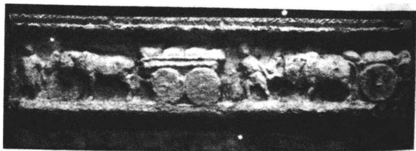
3. 小亚细亚的货运状况