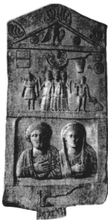
2. 弗里季亚的一个地主及其妻子的墓碑