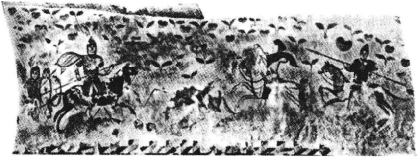
2. 一个地主在和斯基台人作战