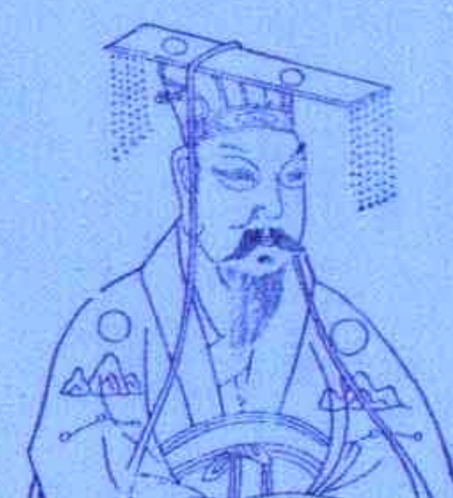
隋文帝 杀印流通，成为开国皇帝