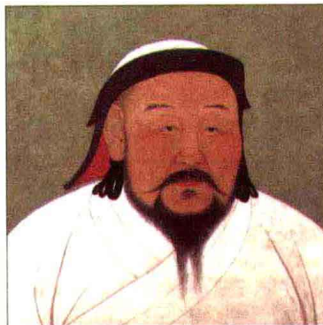
忽必烈：乙木生于8月