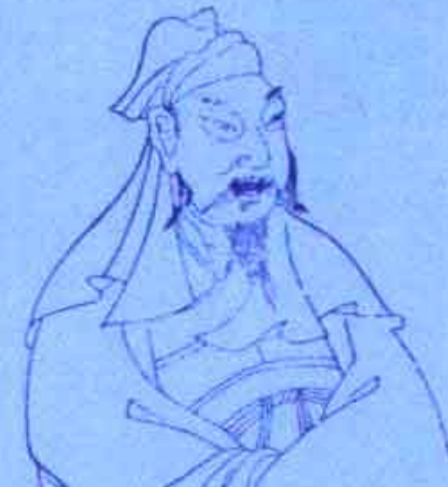
李白 伤官旺而无制，宦海失意