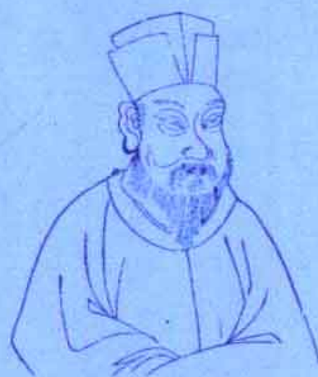
邵雍 地支三会印局，淡泊名利