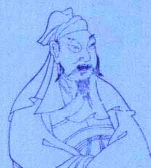
李白 伤官旺而无制，宦海失意