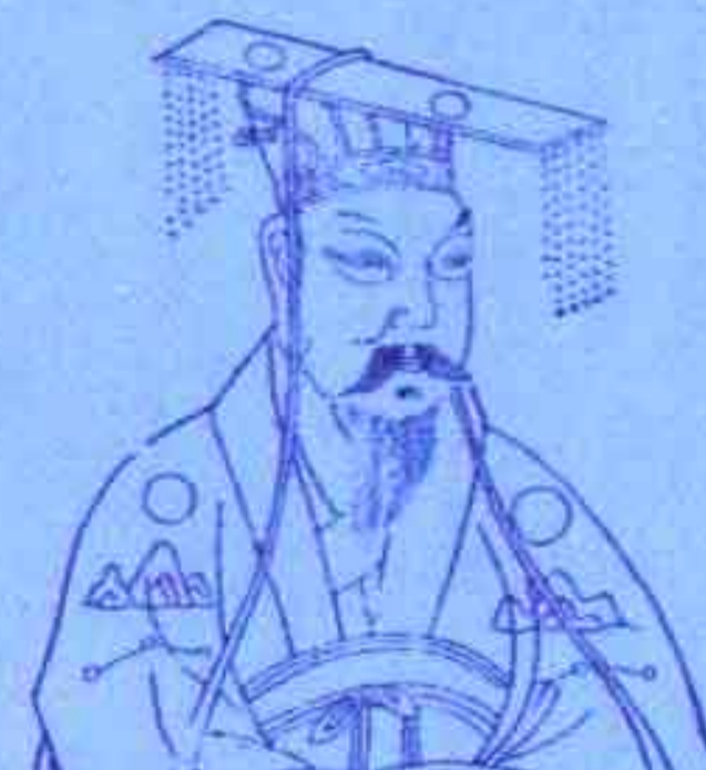
隋文帝 杀印流通，成为开国皇帝