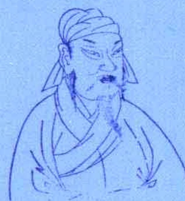
韩信 三酉冲一卯，危机四伏