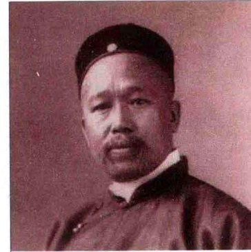
康有为：壬水生于2月