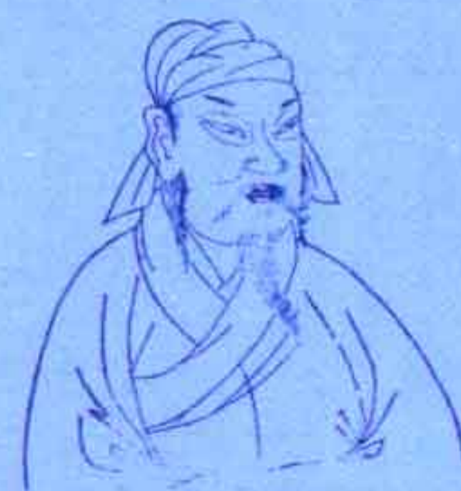
韩信 三酉冲一卯，危机四伏