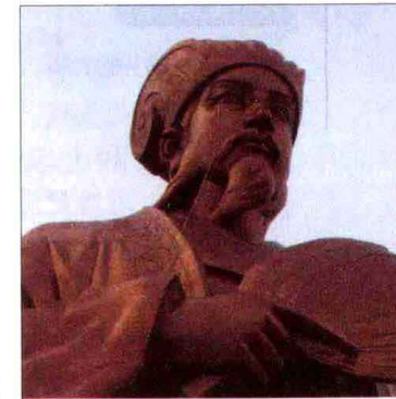
诸葛亮：癸水生于7月