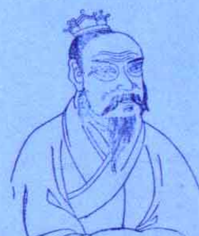
刘邦 巳蛇合穿申位，斩白蛇而起义