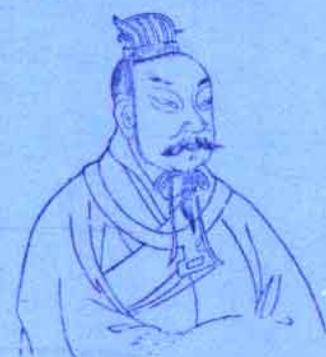
颜回 坐支羊刃受冲受穿，早亡之象