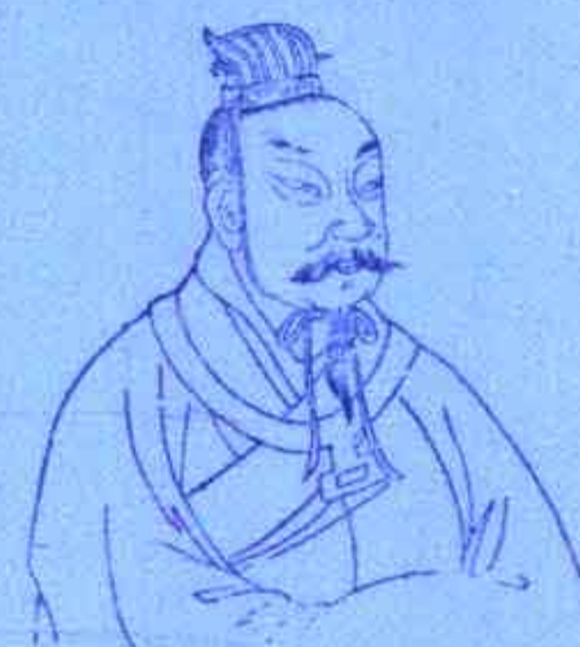
颜回 坐支羊刃受冲受穿，早亡之象