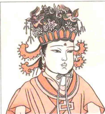
武则天：甲木生于1月