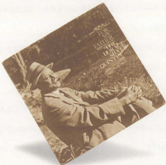
SONG FOR MY FATHER (Blue Note BST—84185)