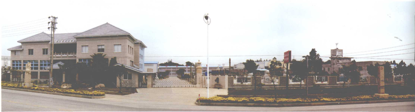
新海峡石业艺术有限公司、浩然古建园林工程有限公司

艺术家、收藏家、投资爱好者、企业家、消费大众提供了一个交流与沟通的平台；同时，也为园林古建筑与雕刻文化的传承、创新、发展，为建筑装饰、建筑幕墙艺术形式与技艺创新提供了系统的理论依据和丰富的实践经验。2008年，企业又发起承办了“海峡情”首届全国高校毕业生石雕创作营活动，为艺术院校学生与惠安本地从事传统雕刻的从业人员提供了难得的交流和促进的机会；让从业人员有机会接触到与传统思维定势不同的创作手法，让学生对以石为艺术创作材质的雕刻创作形式更为了解，培养兴趣，拓宽创作思路，同时，也为当地业界“校企合作”模式作了有益的探索与尝试。由此，也为企业的发展壮大、发展规划制定提供了思路与线索。