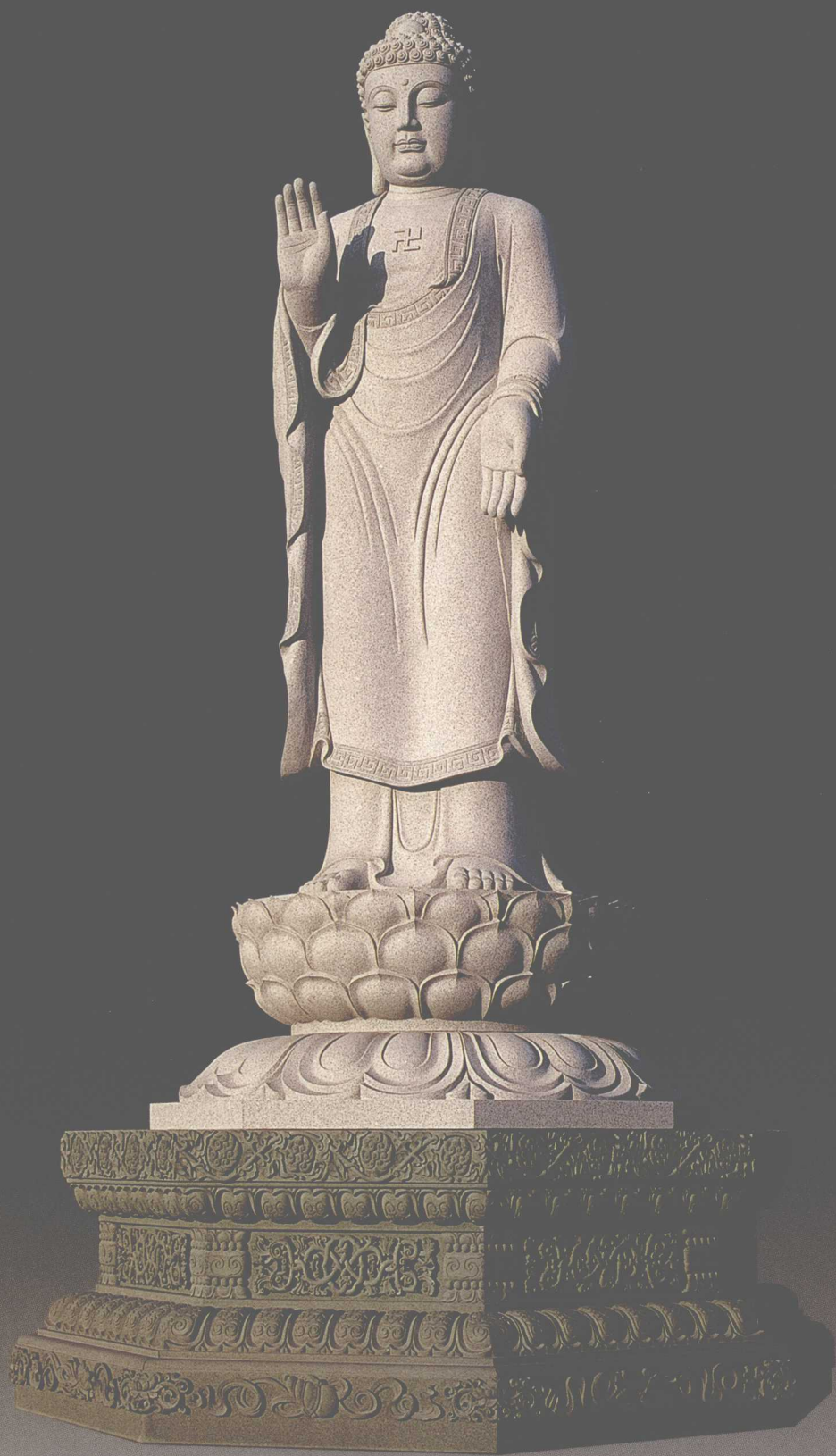
《释迦牟尼》花岗岩 450×150×150cm 底座青石 260×260×120cm

释迦牟尼的意思是“能仁”、“能儒”、“能忍”、“能寂”，因父为释迦族，成道后被尊称为释迦牟尼，即“释迦族的圣人”，源于印度。该作品气势雄伟，慈祥端庄，作品不论在整体构图的把握方面，还是细节的刻画上都做到尽善尽美，可谓是巧夺天工。特别在底座的配置上都显得极为精美，整件作品具有较高的艺术欣赏价值。