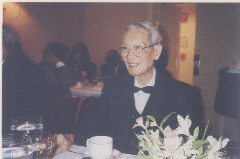
■ 攝於美國華盛頓美國亞洲學會上，1992年。