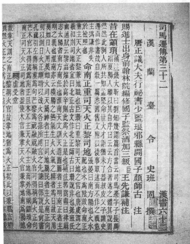
↑『司馬遷傳第三十二』

公元前 91 年(汉武帝征和二年),55 岁,完成《史记》的撰写,人称其书为《太史公书》。