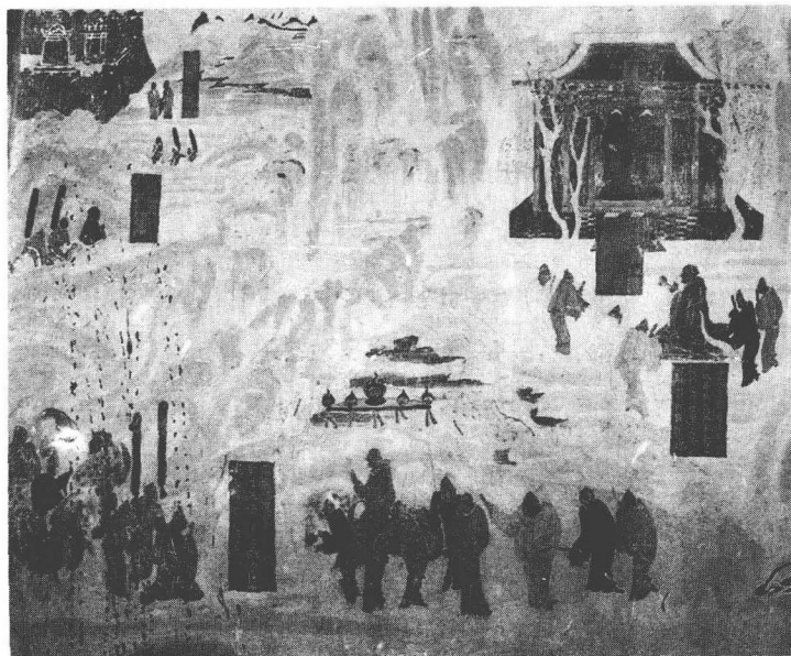
← 张骞通西域(敦煌壁画)