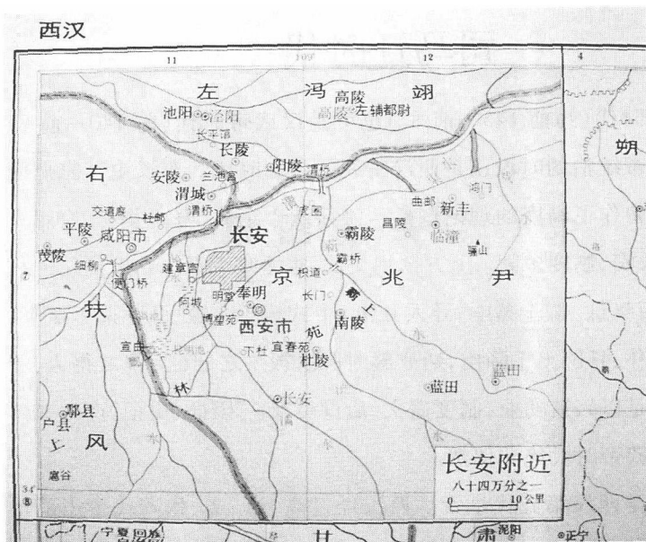
← 西汉长安附近地图 (采自谭其骧编《中国历史地图集》)