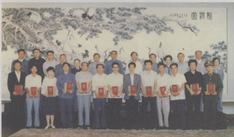
1986年 8月在吉林 省长白山 参加第三 届全国优 秀剧本创 作奖颁奖 会，领取 获奖证书 时的合影