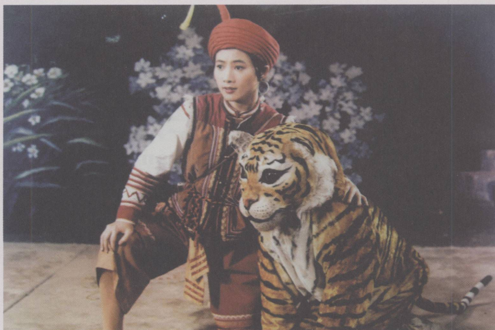
儿童剧《月琴与小老虎》