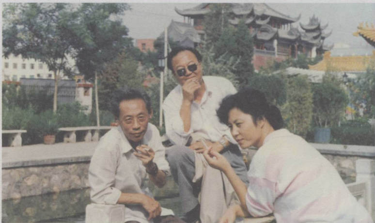
1987年在宁夏银川参加全国话剧研讨会时与新疆乌鲁木齐市话剧团朋友在一起。