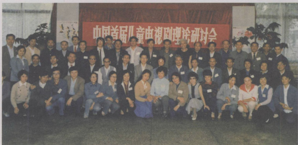
参加中国首届儿童电视剧理论研讨会与同仁合影