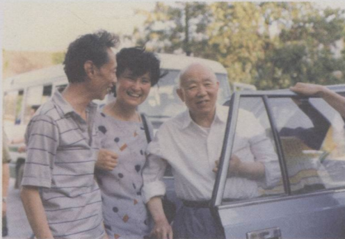
上世纪80年代与四川省原省委书记廖志高等在一起