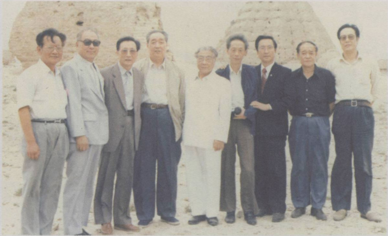
与全国话剧创作人参观西夏王陵留念