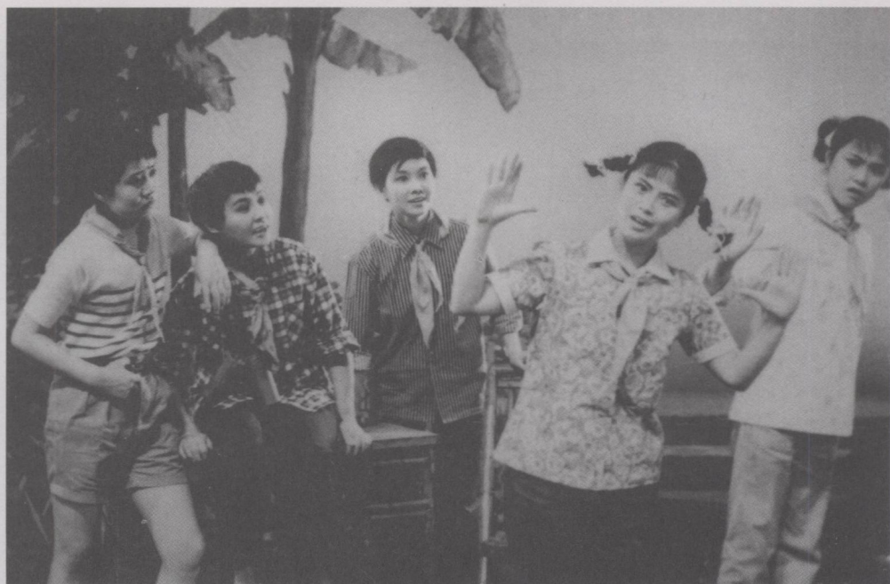
儿童剧《少先队员的秘密》