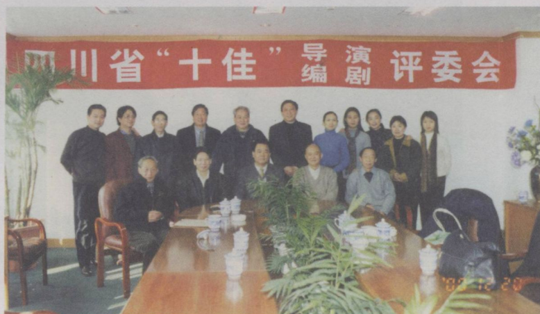
2001年 参加四川 省“十佳” 导演、编 剧的评委 会评委会 合影