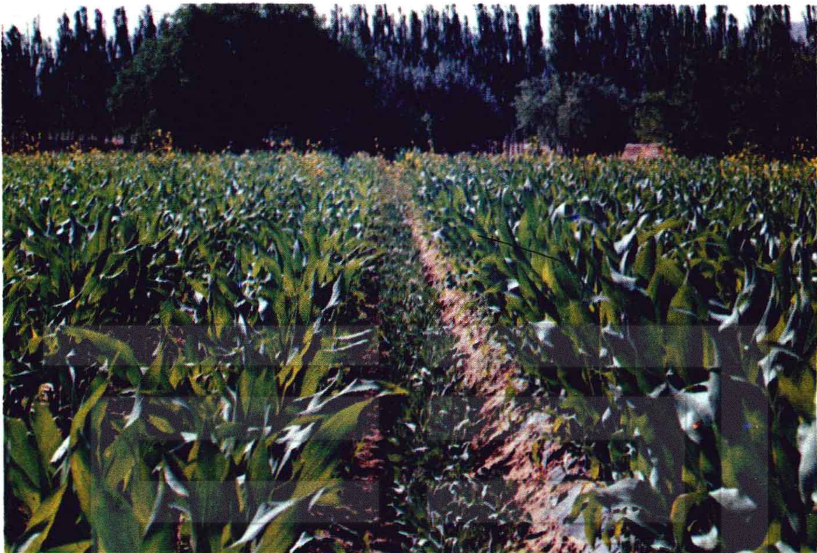
皮山县“温饱工程”——地膜玉米