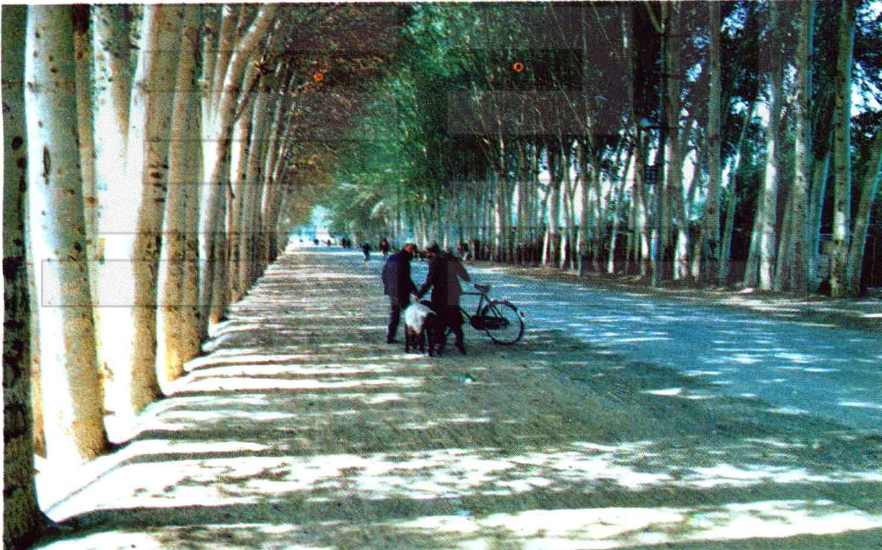
和田农村道路四通八达，乡乡都通上了柏油路