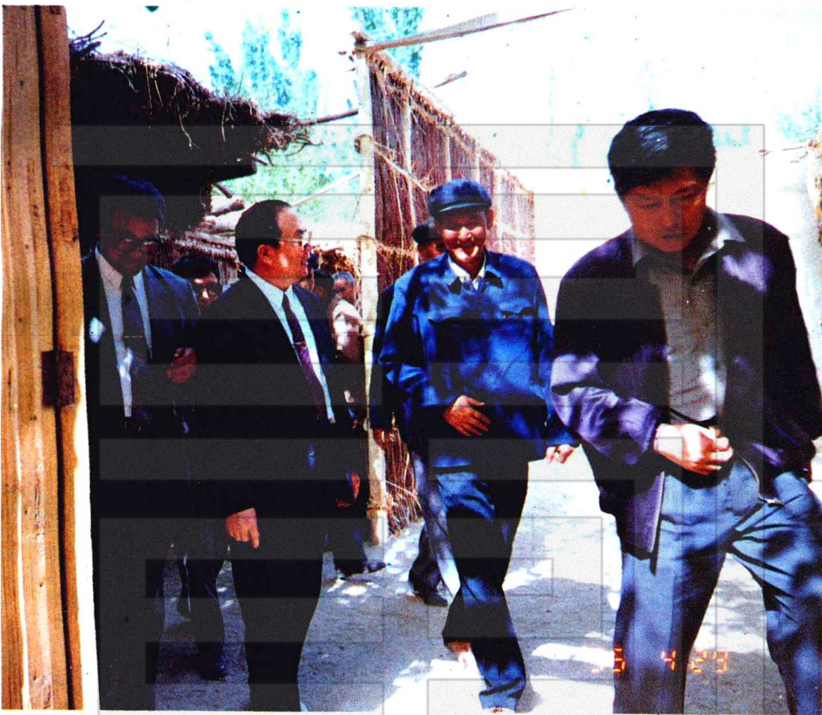
自治区党委代书记王乐泉同志在和田农村考察