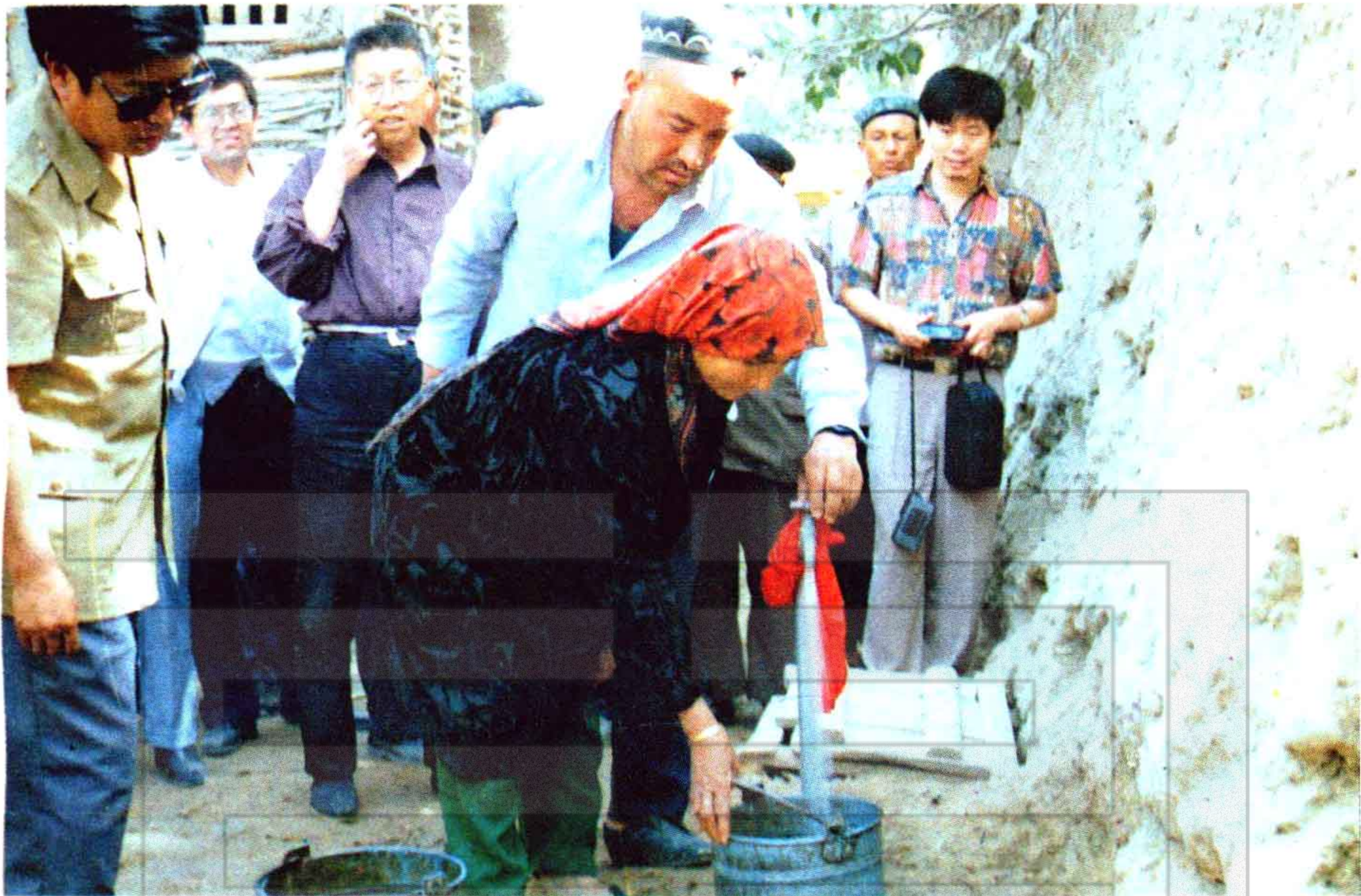
和田县打井饮水工程给人民带来了希望，图为群众喜 接幸福水