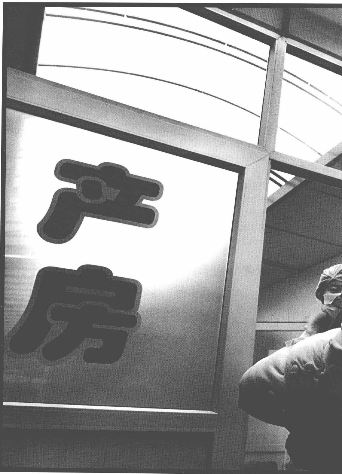
在产房外接过粉小妹的一刻