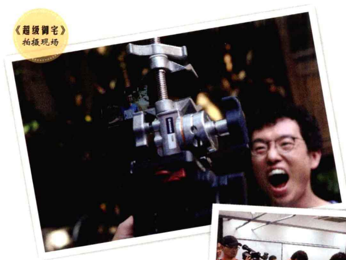
《超级调宅》 拍摄现场