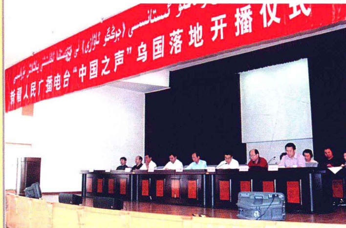
2004年7月20日,新疆广电局举行新疆广播维吾尔语“中国之声”落地乌兹别克斯坦开播仪式。