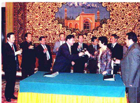
中吉两国广播合作成功,2004年5月14日签约后,新疆广电局局长肖开提·依明与吉尔吉斯斯坦广电集团总裁阿依基科耶娃举杯祝贺。