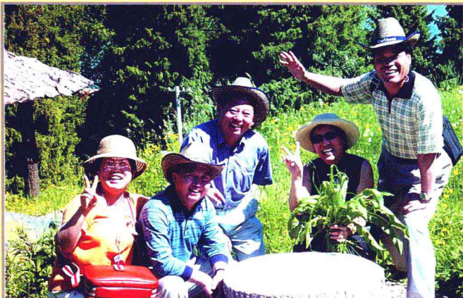
中国广播电视学会会长、原中国国际广播电台台长张振华(左二)2004年来新疆人民广播电台考察广电“走出去工程”时在景区小憩。