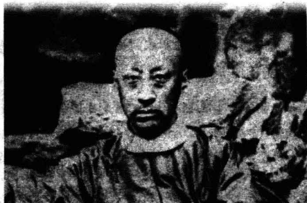
奕訢在恭王府花园