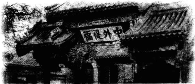
清处理洋务的办事机构——总理衙门

把欧洲人称为“夷”，自然反映了中国传统的自尊自大观念。为此曾引起一些来华的洋人们的不满。还在1832年，英国东印度公司职员胡夏米，因上海的地方官员给他的批文中有“该夷”字样，便上书