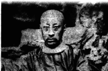
奕訢在恭王府花园

随着中国不断被西方列强侵略，清政府同洋人的交涉也越来越多。1860年冬，清政府一度设立抚夷局于北京的嘉兴寺，调派满汉官员轮番到局办公，处理对外交涉。不久，清政府发现这个名称不妥，随即改称总理各国事务衙门，成为主持洋务的中央机关。