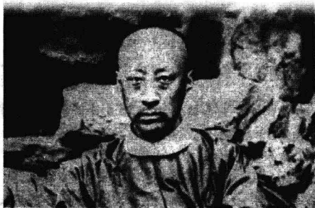
奕訢在恭王府花园

奕訢是道光皇帝的第六个儿子，是咸丰皇帝的弟弟。1850年，道光皇帝病逝，咸丰接位，奕訢被封为恭亲王，这时他17岁。到20岁的时候，奕訢成为军机大臣，成为参与朝廷决策的重要人物。他是主张镇压太平天国革命同抵御外国侵略并重的，认为这两方面都是清政府的敌人。当两个拳头不可能同时打这两个敌人的时候，他采取“两害取轻”的办法，联合外国侵略者去共同镇压太平天国，与英法两