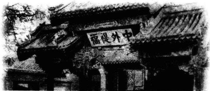
清处理洋务的办事机构——总理衙门

过了几天，皇帝同意了这些建议。1月20日，清政府正式设立了总理各国事务衙门，简称总理衙门，又简称为总署或译