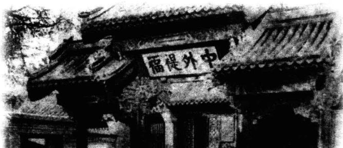
清处理洋务的办事机构——总理衙门