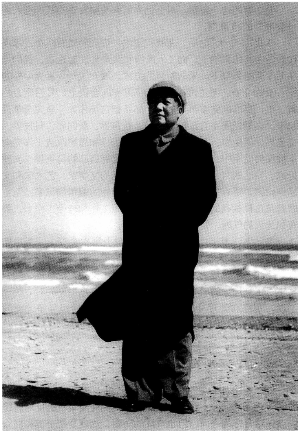
1954年，毛泽东在北戴河。