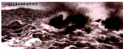
神游浩瀚 意卷风涛