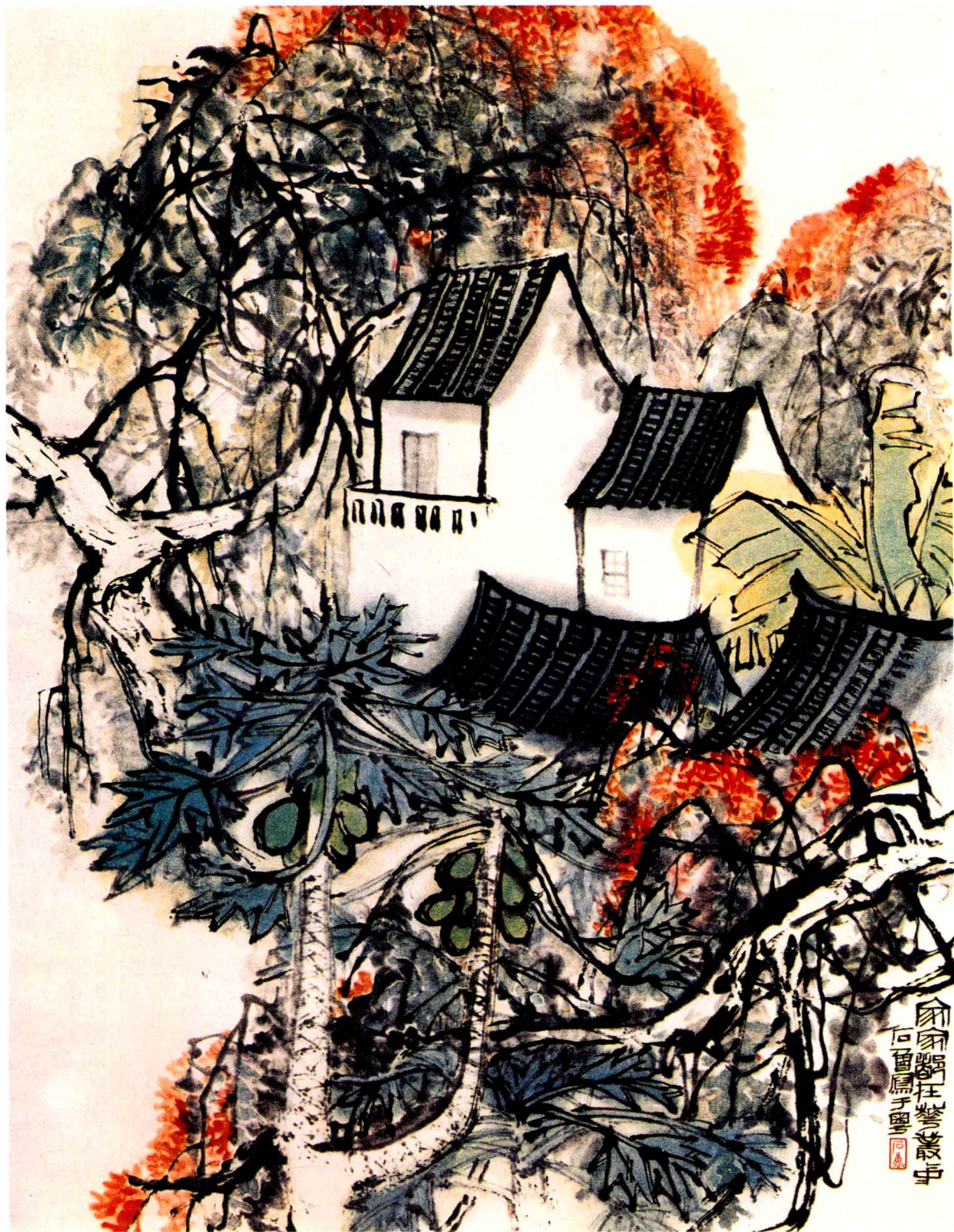
◎家家都在花丛中 / 石鲁