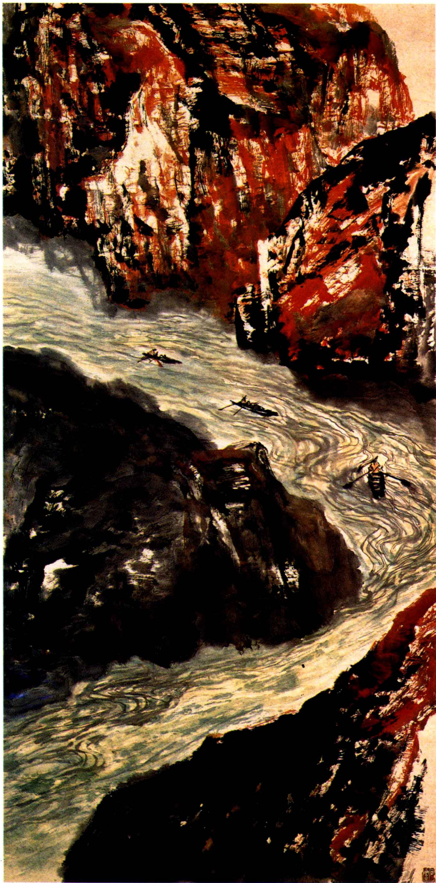
◎赤崖映碧流 / 石鲁