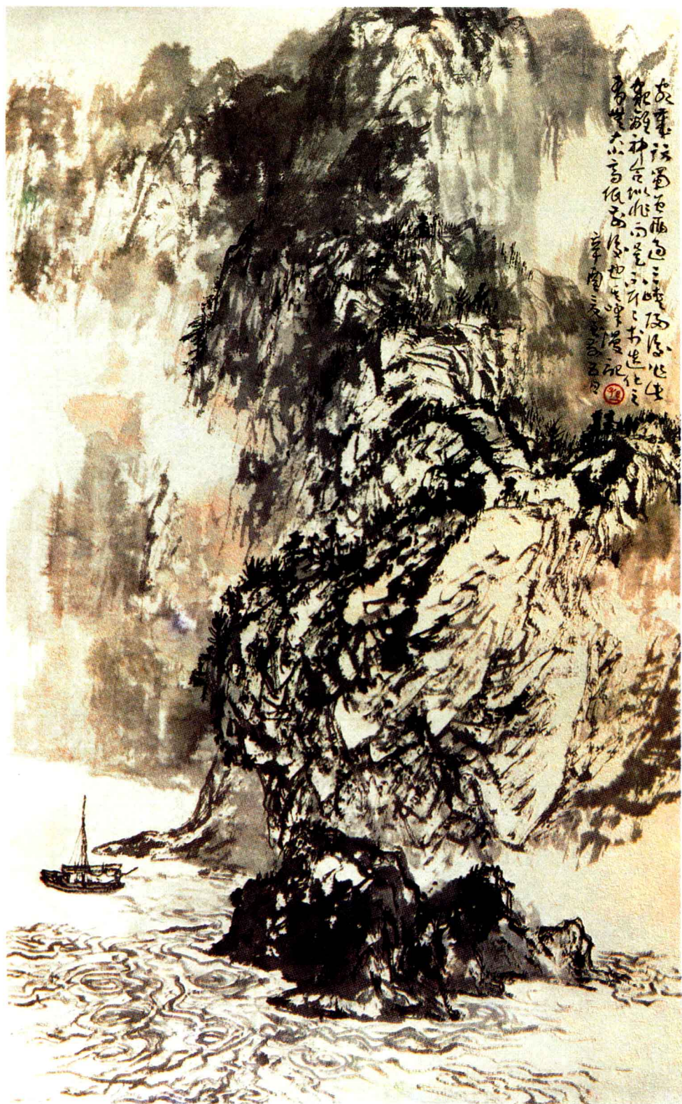
◎三峡印象 / 孙其峰