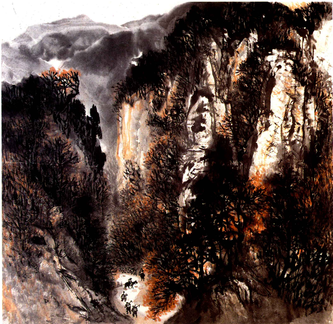
◎南泥湾途中 / 石鲁