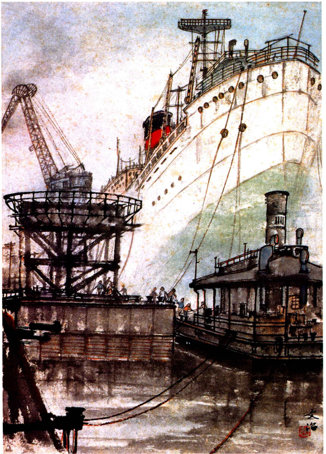
◎广州造船厂 / 宋文治 1960年 纸本设色 40cm × 28cm 家属藏

◎宋文治（1919~1999），江苏省太仓县人。早年毕业于苏州美术专科学校，后在太仓、安亭从事美术教育工作。1957年任江苏省国画院画师，1978年任副院长，并为该院一级美术师。曾任江苏省美术家协会副主席、江苏省文联委员、南京大学教授、中国美术家协会理事。