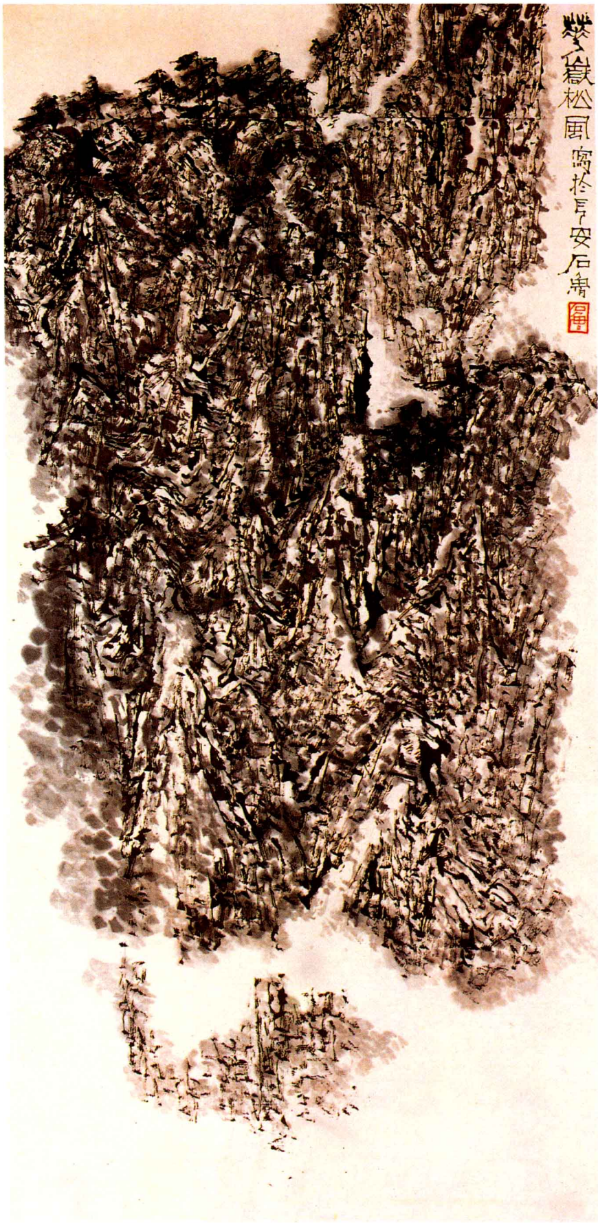
◎华岳松风 / 石鲁