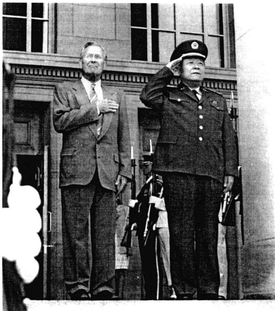
2006年7月18日，美国国防部部长拉姆斯菲尔德在五角大楼前欢迎到访的中国中央军委副主席郭伯雄一行。