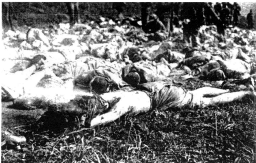
如果中国不拒绝当初的停战提议，不会有如此惨重的伤亡。 图为一名死去的中国军人的制服还在冒烟（见 P150-P152）