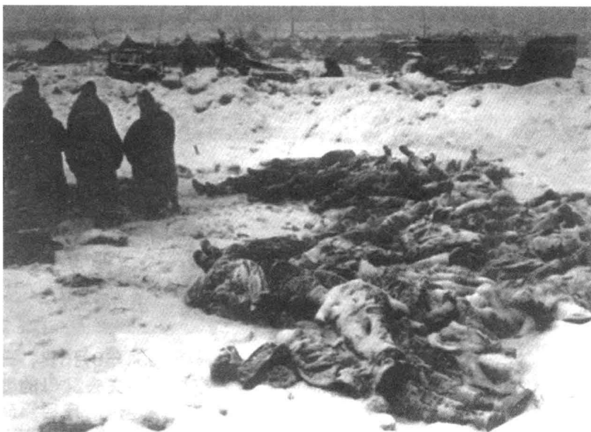
联合国军的阵亡士兵