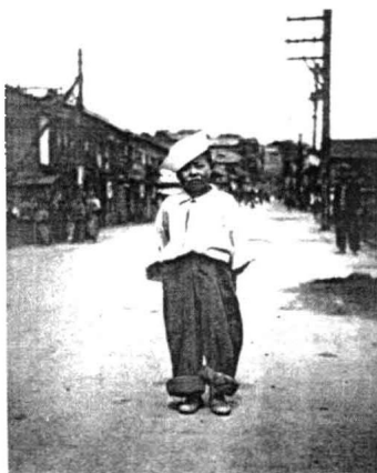
1951年6月6日，一个在战争中失去父母的朝鲜孤儿，经过治疗后重新获得健康，在街道上留影。