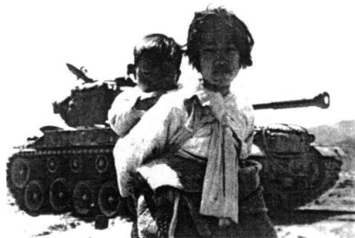
1951年6月9日，京几道Haengju一个疲倦的小姑娘背着她的小弟弟，在蹒跚地向前走，背后停着一辆美军的M-26坦克