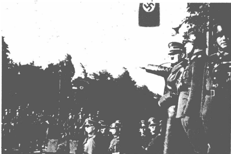
希特勒检阅士兵，做战前动员。

希特勒的想法截然相反，在他眼中，斯大林格勒是苏联欧洲部分东南部的政治、经济、文化中心，铁路和水运交通枢纽，也是非常重要的军工基地和战略要地。所以，他才把斯大林格勒列为重点