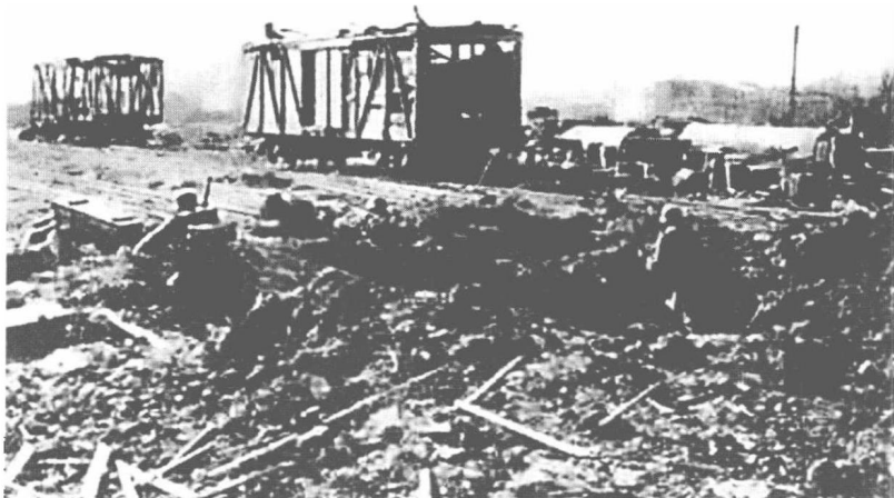
斯大林格勒1号火车站 争夺战

他们的确有危险，苏联人决定把1号火车站夺回来。派去夺取1号火车站的是苏军最具野性的近卫师第42团第1营。这个营是一个加强营，包括一个迫击炮连、一个反坦克枪连，一个自动步枪排和一个工兵排，共300多人。