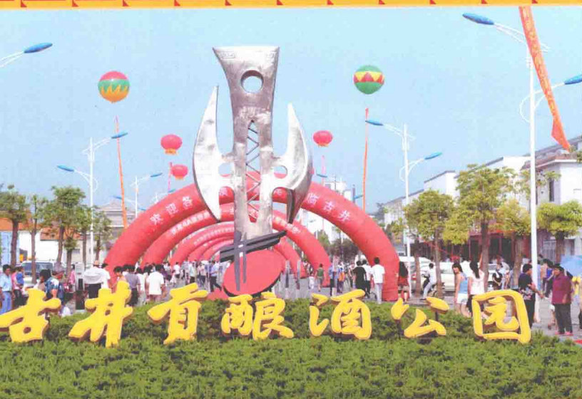
古井贡酿酒公园入口