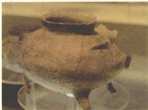
◆ 大汶口文化猪形陶

图腾是“氏族”、“亲属”、“标记”的意思。图腾文化是人类文明历程中一种非常独特和奇妙的现象，图腾崇拜作为最早的宗教信仰方式之一，遍及世界各地。早在母系氏族社会时期，人们为了对不同的氏