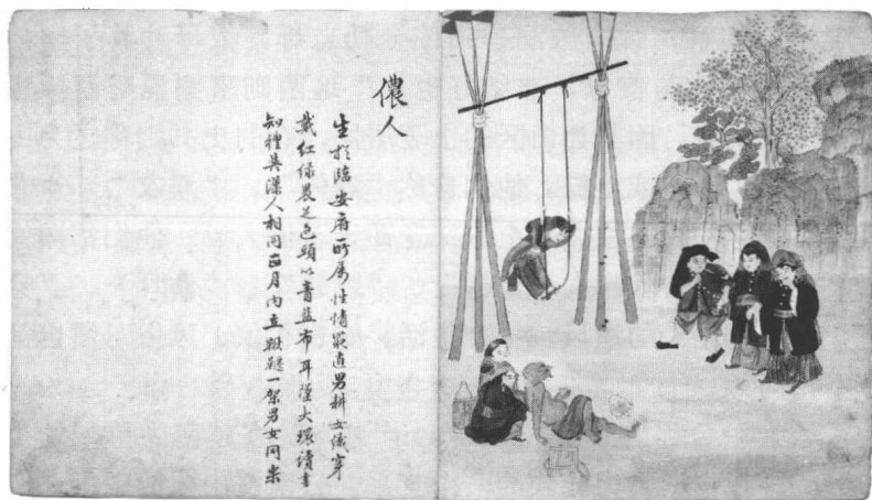
图3 “濮侬 (phu 22 noŋ 44 , 侬人)” 录自《滇省迤西图说》