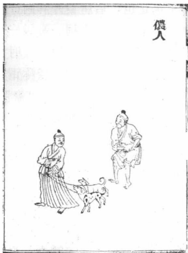
图2 “濮侬 (phu 22 noŋ 44 , 侬人)” 录自道光《云南通志种人》

侬人源于唐代的西原蛮，其首领有侬金勒、侬金澄、侬仲武和侬金意等。唐末以后，侬人活跃于今滇东南、桂西南及越南北部。五代南汉政权时，侬民富为广源、武勒、南源、西源、西农、万涯、复和、温弄、古拂、八耽等十州峒的大首领。大理政权曾封其为坦绰（意即郡国之王）。宋灭南汉后，又“诏授侬民富金紫光禄大夫、检校司空兼御史大夫、上柱国”。明天启《滇志》卷三十说：“侬人，其种在广南，其首为侬智高裔，部夷也自号侬。”