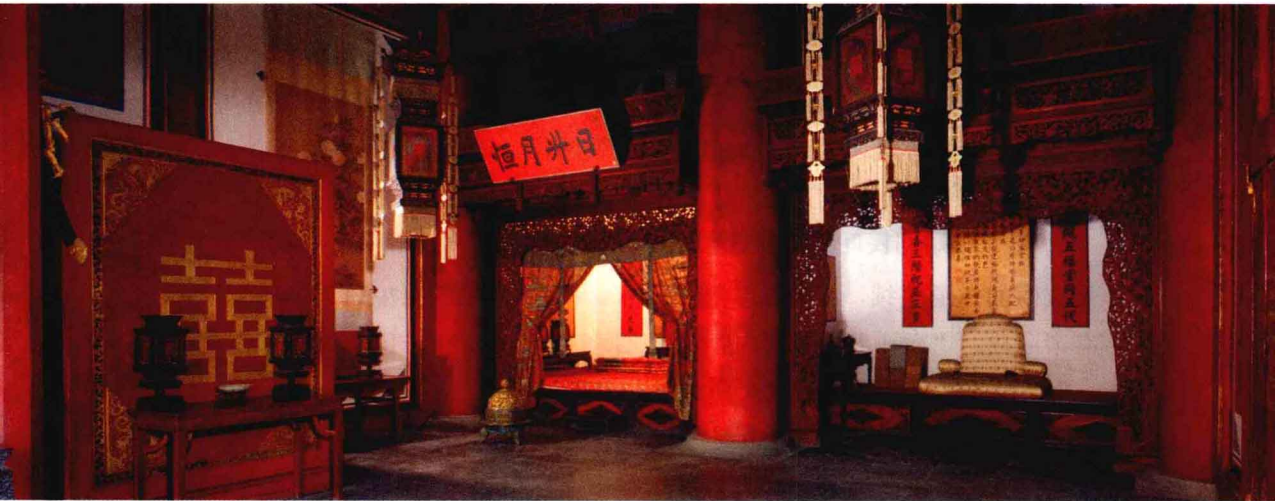
坤宁宫一直是皇后正宫，图为东暖阁的皇帝洞房