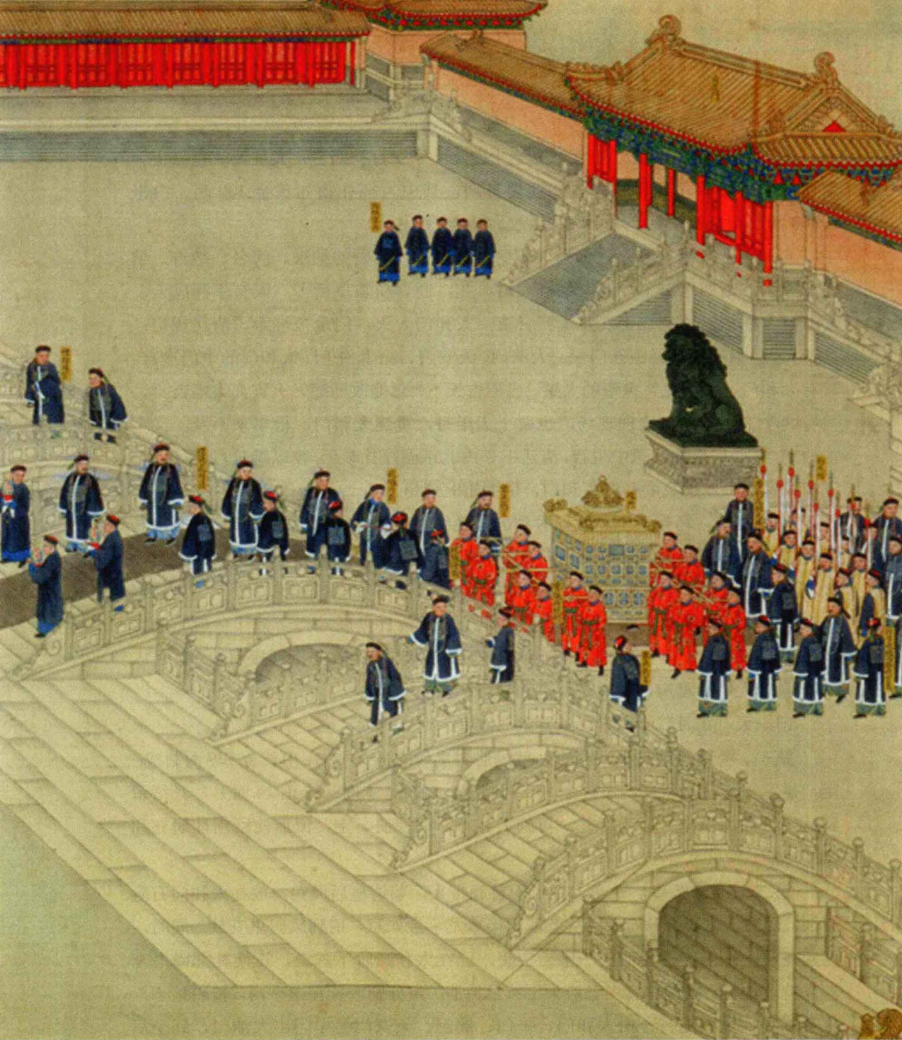
突如其来的大火，催生了《光绪大婚图》中以假乱真的彩棚太和门