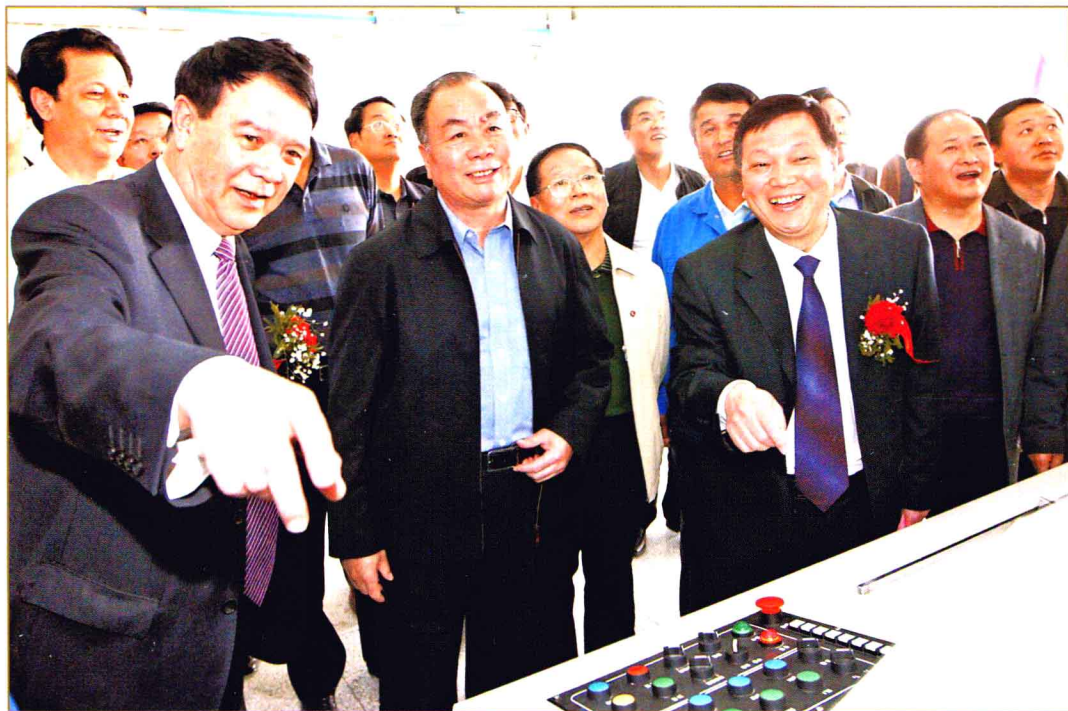
2009年4月6日,新疆日报社南疆印务中心在喀什落成,中共中央政治局委员、自治区党委书记王乐泉为印务中心剪彩并讲话。图为王乐泉(左二)在社领导的陪同下启动了彩报印刷机。