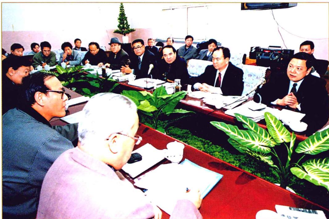
1999年12月16日,自治区党委书记王乐泉(右二),自治区党委副书记、自治区主席阿不来提·阿不都热西提(右三),自治区党委副书记、自治区常务副主席张文岳(右一),自治区党委常委、宣传部部长吴敦夫(右四)等来新疆日报社考察工作。