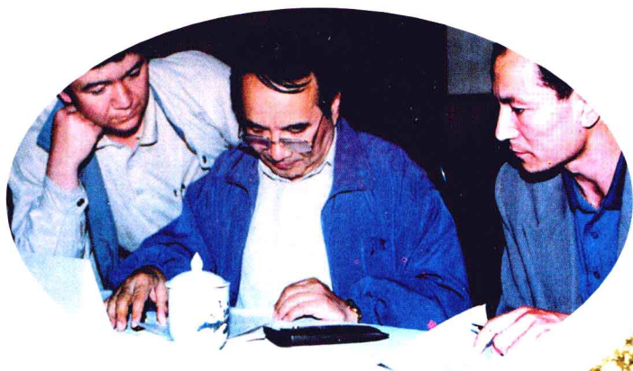
1997年5月，自治区主席阿不来提·阿不都热西提（中）在喀什考察工作时，审阅本报记者采写的稿子。