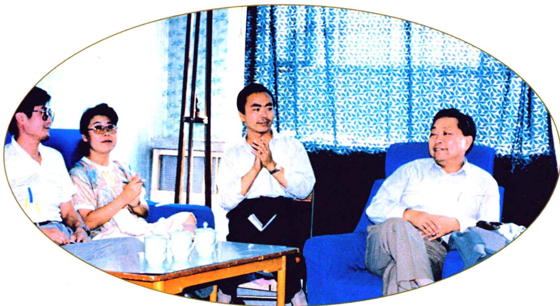
1990年9月,新疆日报社在乌苏召开记者工作会议。正在北疆地区检查工作的自治区党委书记宋汉良(右)专程来到宾馆,看望参加会议的《新疆日报》驻站记者。