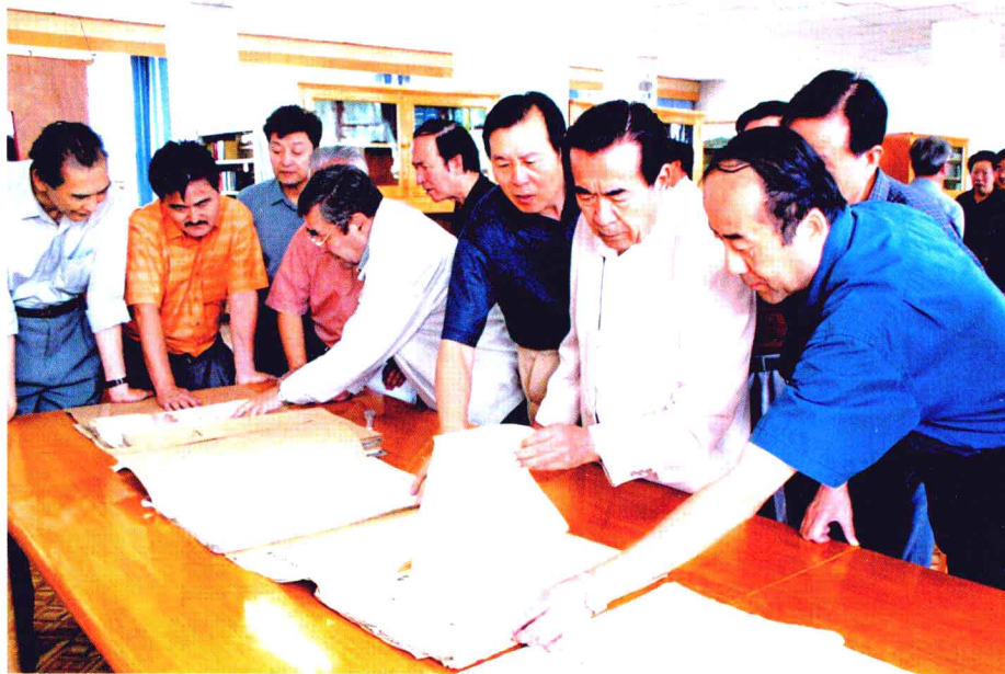
2004年8月10日，全国人大常委会原副委员长铁木尔·达瓦买提（右二）在自治区人大常委会副主任胡吉汉·哈克莫夫（左四）的陪同下来报社看望各族职工。图为在资料室参观。