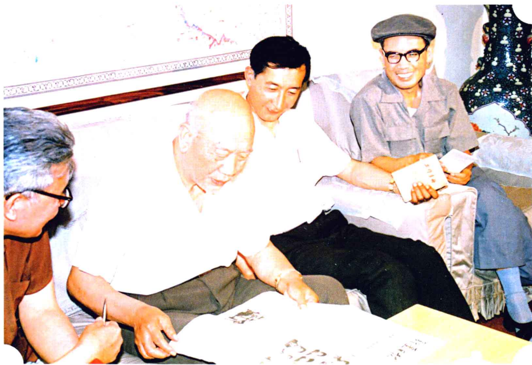
1989年7月,全国政协副主席、自治区顾委主任王思茂(右三)接受新疆日报社记者采访,阅读《新疆日报》。