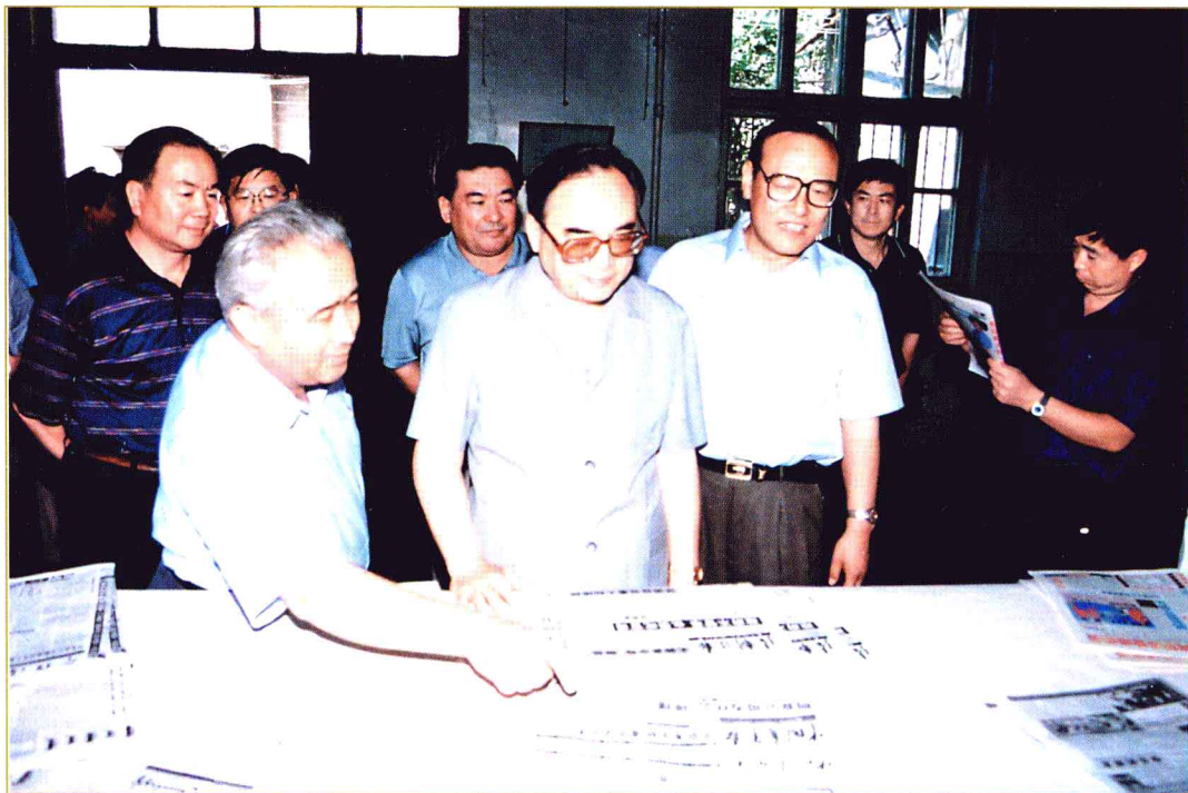
2000年8月12日下午,中共中央政治局委员、中央书记处书记、中宣部部长丁关根(中)在自治区领导王乐泉等陪同下来到新疆日报社考察。