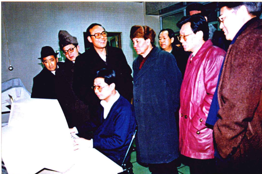
1993年除夕之夜,自治区党委副书记贾那布尔(右三)、自治区党委宣传部部长李康宁(右二)、宣传部副部长邵强(右一)等到新疆日报社看望坚守工作岗位的各族职工。图为参观汉文激光室。