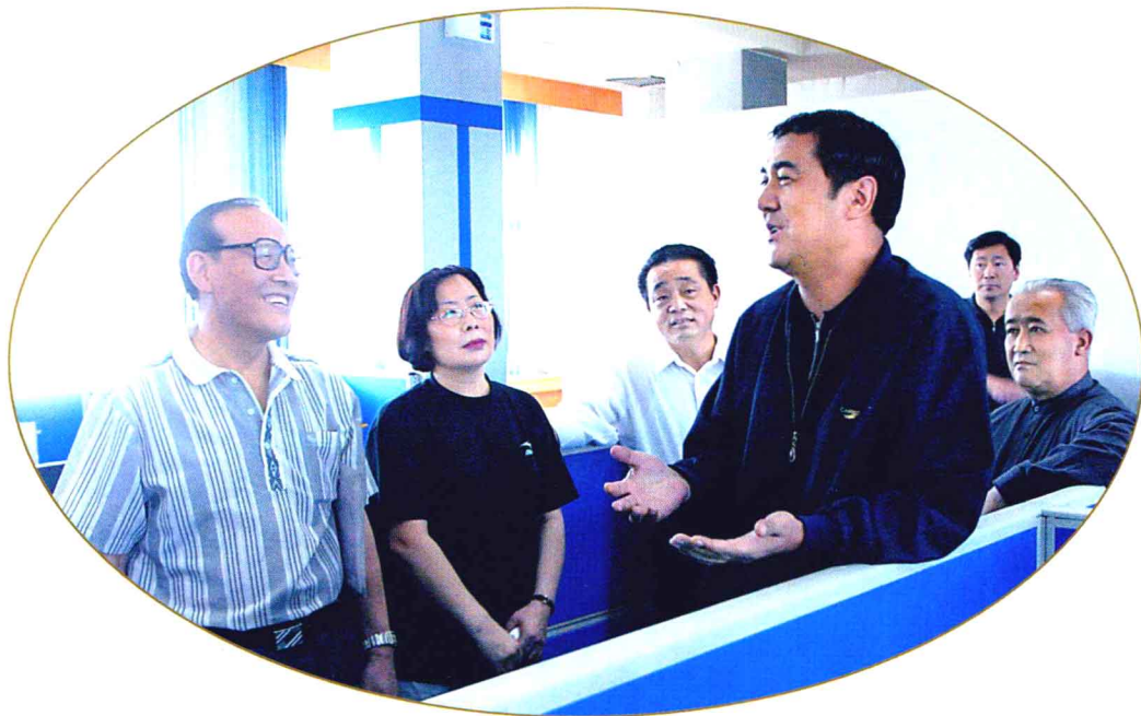
2003年5月30日上午,自治区党委副书记努尔·白克力来报社调研,考察了印务中心、新疆都市报、汉编部,听取了报社党委领导的工作汇报。