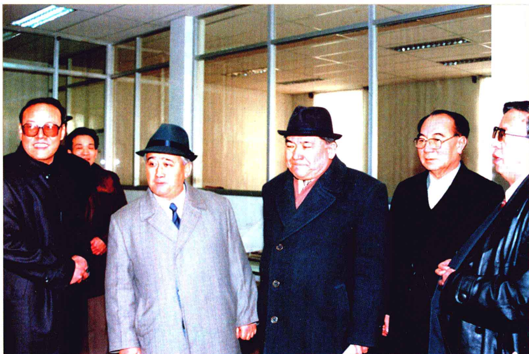
1997年2月7日上午,自治区党委副书记克尤木·巴吾东(右三),自治区副主席米吉提·纳斯尔(右二)、王怀玉(右一)来新疆日报社慰问。