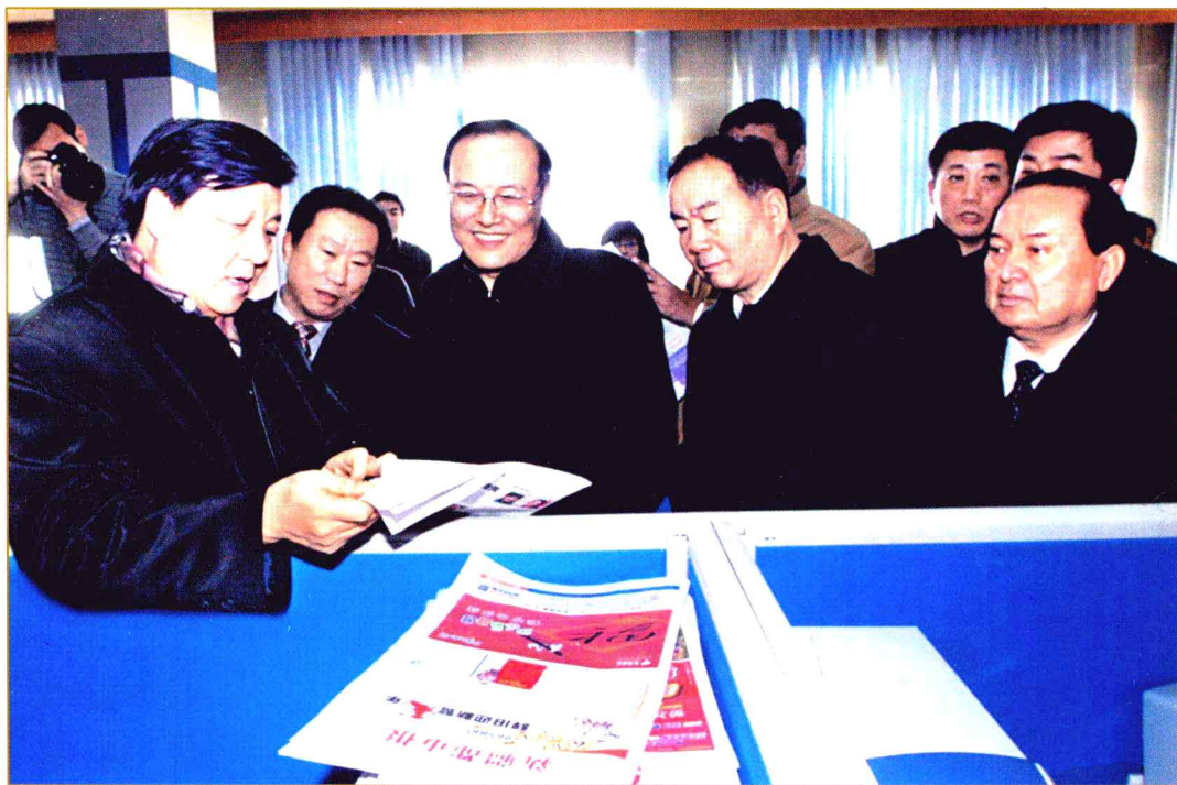
2006年1月14日上午,中共中央政治局委员、书记处书记、中宣部部长刘云山(左一)在中共中央政治局委员、自治区党委书记王乐泉(右二),自治区主席司马义·铁力瓦尔地(右一)等领导的陪同下来到新疆日报社考察。