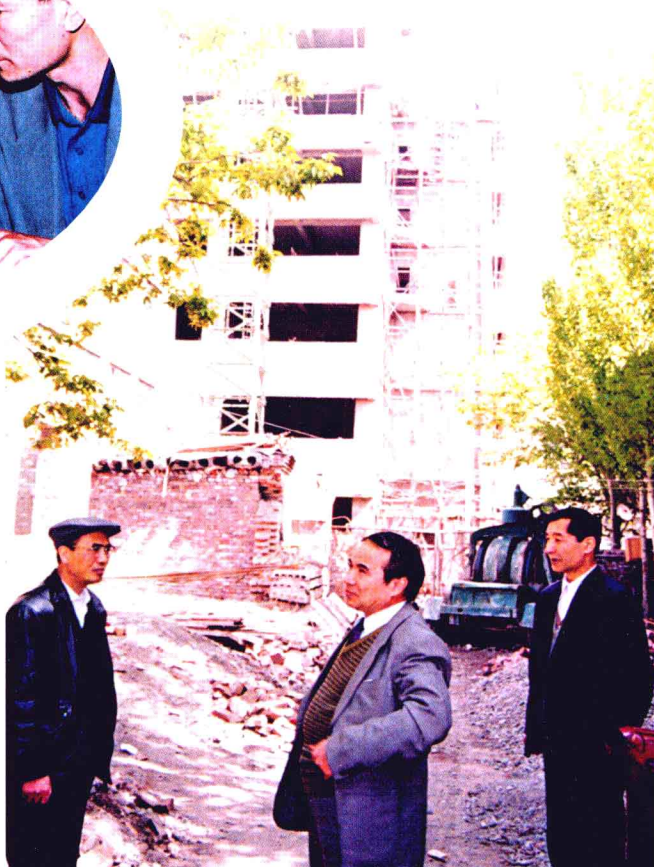
1993年5月12日，自治区副主席阿不来提·阿不都热西提（中）在报社社长排祖拉、副社长田玉棉的陪同下察看新闻大楼施工现场。