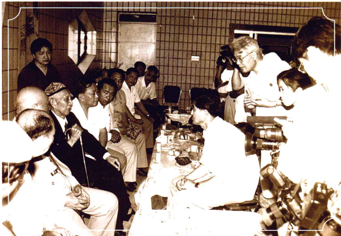
1992年,王震来新疆考察,记者随同采访。