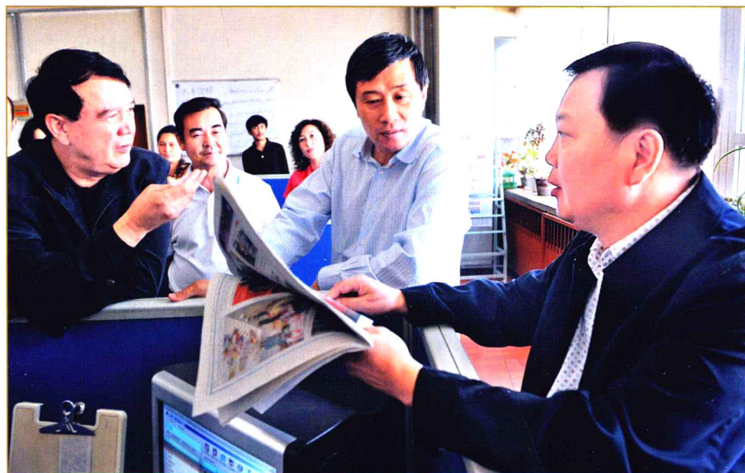
2009年9月7日,中共中央宣传部副部长孙志军(右二)考察新疆日报社。