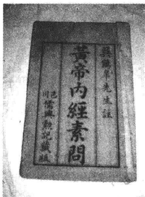
图1-1 清代版古籍书 《黄帝内经·素问》