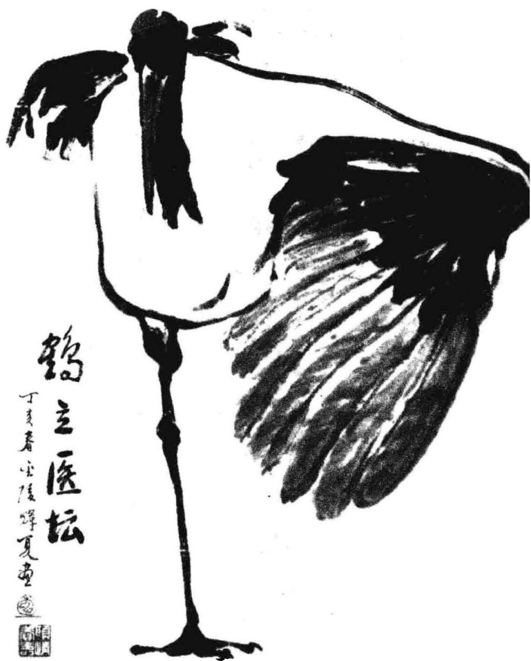
全国著名画家武辉夏先生为本书作画