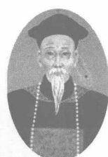
民族英雄，时任两广总督的邓廷桢