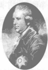
被嘉庆皇帝赶出中 国的使者阿美士德