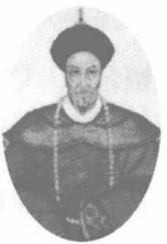
在定海英勇牺牲的寿春镇总兵郑国鸿