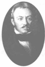
与清政府签订《南京条 约》的驻华大使，也是 首任香港总督的璞鼎查