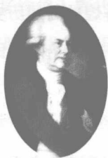
首位访华的英国 大使马夏尔尼