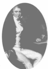
英国最大的鸦片贩子，威廉·查顿