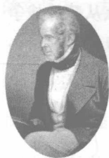
一生醉心霸权的 英国首相巴麦尊