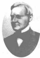
在广州上缴了所有鸦片 的驻华商务监督义律