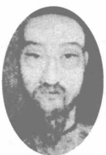
与璞鼎查签订《南京条约》的耆英