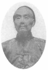
死守定海英勇就义的定海镇总兵葛云飞