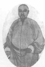
在虎门销烟的民族英雄林则徐