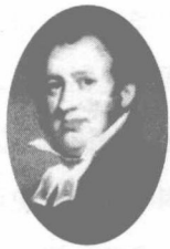
为中国做出贡献的 传教士马礼逊