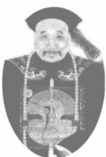
建造厦门石壁炮台的闽浙总督颜伯焘