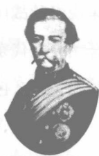
首任驻华商务总 监督，被气死在澳门的律劳卑