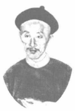
鸦片战争时清政府首席军机大臣穆彰阿