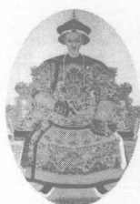
吝啬一生的道光皇帝旻宁