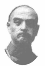
抗击英军自杀殉职的两江总督裕谦