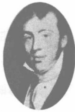
英国第二大鸦片贩子， 宝顺洋行的颠地