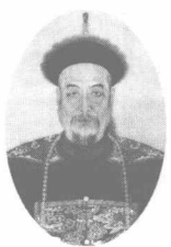
与英军大战虎门的民族英雄关天培