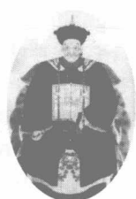
民族英雄江南提督陈化成