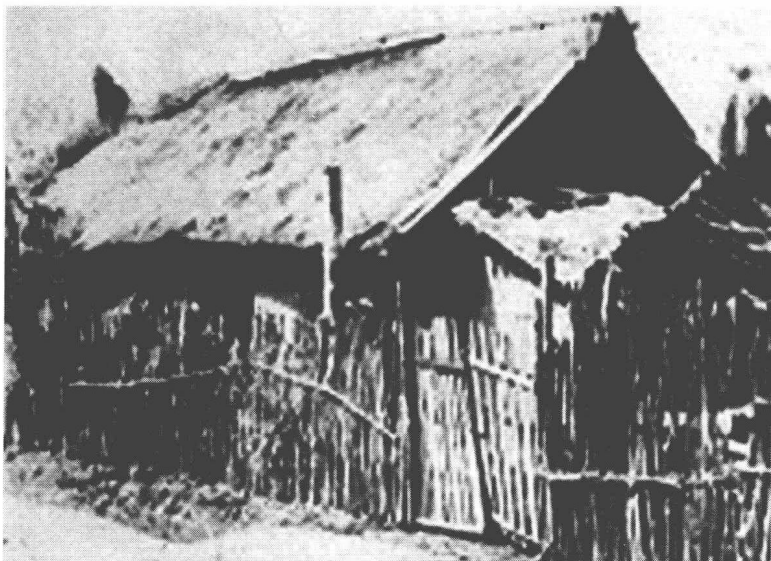
松江省第一农场的开荒总指挥部

里处,组建八一五机械农场。为了解决解放军战士御寒的皮毛装备,1947年在黑龙江省创建了东北萨尔图种畜场(后改名为红色草原牧场)。这是北大荒上建立的第一个畜牧场,主要以养羊和改良羊的品种为主。