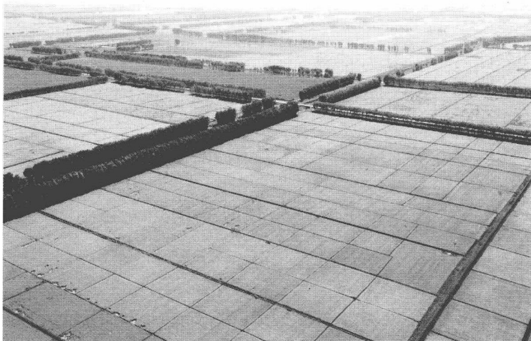
黑龙江垦区大片农田丰收在望

者和冒险家所青睐。据历史记载,北大荒的开发,可以上溯到辽金,乃至秦汉时期,但有组织的开发则是明清之时。明洪武年间,朱元璋推行“足兵、屯田、备边”之策;清王朝实行“旗丁”垦荒制,并在此设置垦务局;民国时期曾放荒垦殖;日本侵略者则移民开拓掠夺……无论是历代王朝,还是外来的侵略者,都难以在此立足,均以最后失败而告终。只有共产党领导下的北大荒人,才真正成为这片土地的主人。