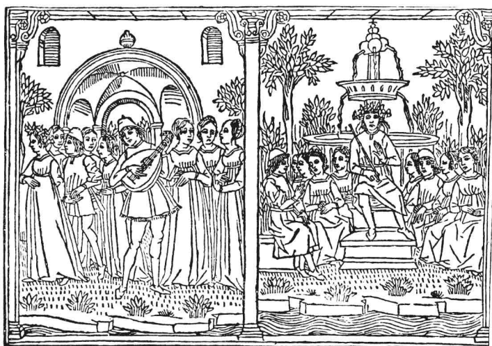
《十日谈》最早插图本的一幅木刻插图