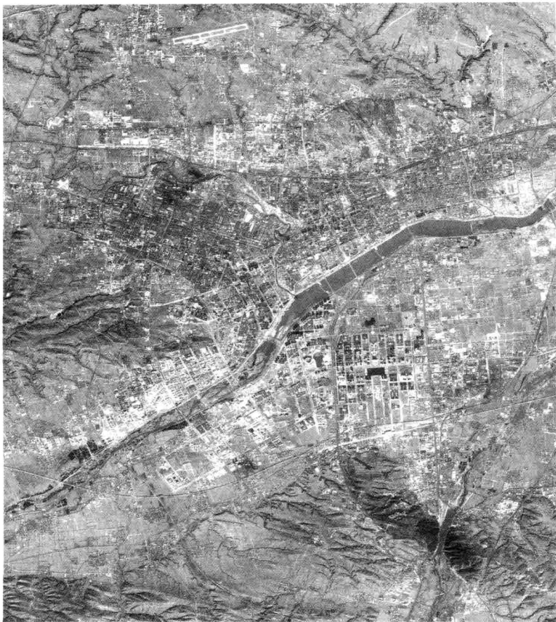
图0.1 现代洛阳城卫星图

迹，供人们凭吊与想象。然而，历经沧桑的山河依旧，伊阙依然雄伟，邙山仍旧壮观，龙门石窟的千年石刻，继续散发着魏隋唐宋的历史华韵；白马寺前的石马石碑，仍然诉说着洛阳城曾经的历史辉煌。而今日焕然一新的洛阳，已然在邙山、伊阙间巍然矗立，满城的富贵牡丹，依然姹紫嫣红，正所谓：“山河萦带九州横。深谷几为陵。千年万年兴废，花月洛阳城。” ③