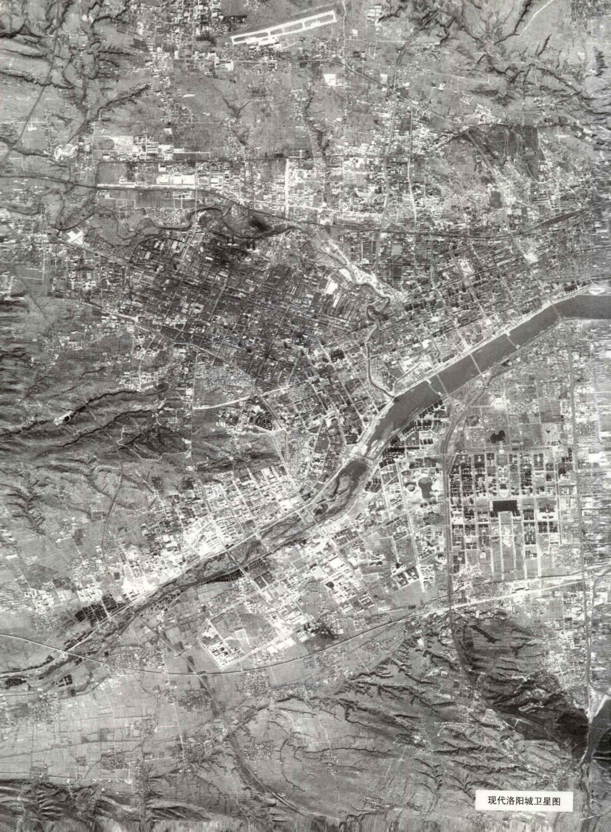
现代洛阳城卫星图