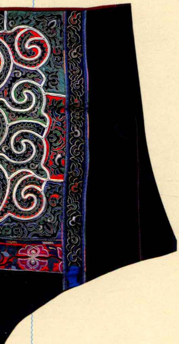
图2 云南壮族“群龙舞云纹”背带[◆]

衣，早已见诸典籍。据《吕氏春秋》记载，大禹曾南至交趾的羽人、裸人之国，可见南方以羽为衣饰传统的久远。羽人实则为越人中以鸟为图腾崇拜的骆越部族，却在中原的神话传说中被衍化为身生鸟羽、遨游云天的神仙。在云南晋宁、广西西林及贵港出土的战国至西汉时期的石寨山型铜鼓上，均以羽人为主纹饰。他们头戴高耸的羽冠，上身赤裸；腰下服上狭下宽的长条形或羽制的前后幅，前幅略长过膝，后幅曳地；跣足；或徒手或手执羽、干戚、籥，正跳着祭神的“武舞”或“文舞”，姿势婀娜，仿佛鹭鸟振飞。而划船的羽人，正合力荡桨，驾着狭长的轻舟迎水神。这奇异的羽人纹饰，既混合了中原文化的因素，又有本民族别出心裁的创造，堪称绝唱，给壮族的铜鼓文化和服饰文化留下无尽的影响。