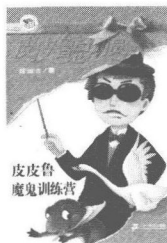
皮皮鲁 魔鬼训练营