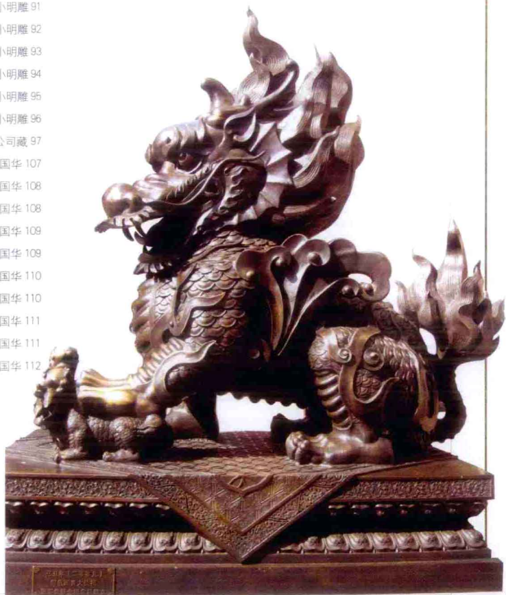
香港赤松黄仙祠铜麒麟