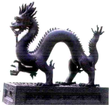
北京故宫储秀宫铜龙

出版 中国林业出版社 (100009 北京西城区刘海胡同 7 号) http://lycb.forestry.gov.cn E-mail: forestbook@163.com 电话: (010)83222880 发行 中国林业出版社 制版 北京捷艺轩彩印制版技术有限公司 印刷 北京中科印刷有限公司 版次 2012 年 1 月第 1 版 印次 2012 年 1 月第 1 次 开本 190mm × 210mm 字数 142 千字 插图约 260 幅 印张 7.5 印数 1 ~ 5000 册 定价 48.00 元