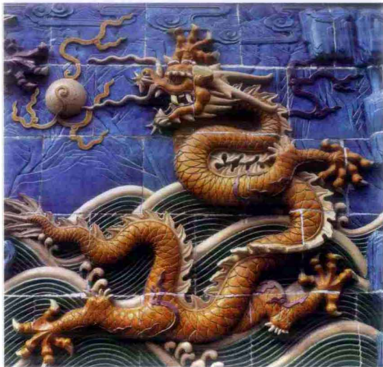
北京北海九龙壁之一