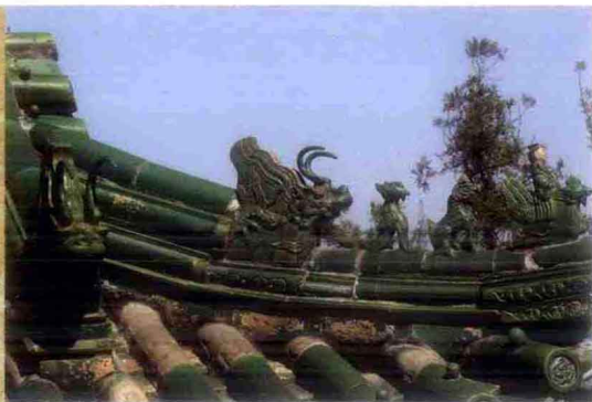
“龙生九子”之一——嘲风