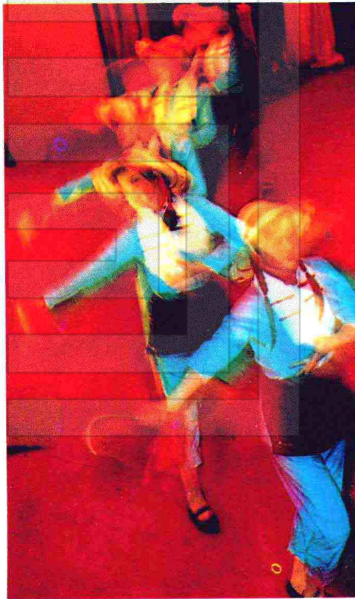
麦子黄，收割忙 颗颗粒粒运上场 酿成美酒庆丰收 喝在嘴里甜又香