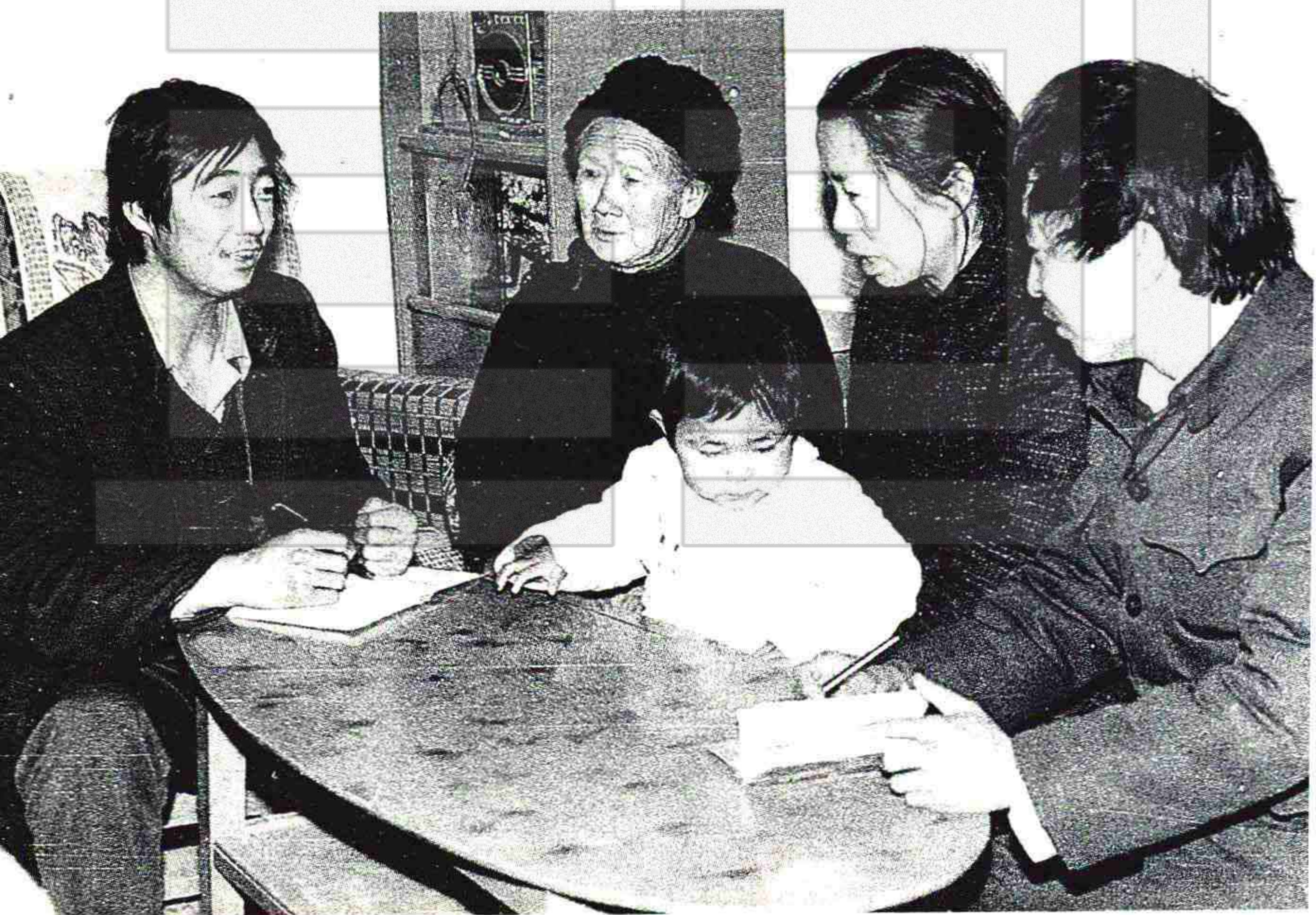
123团的采录员深入家庭采录歌谣