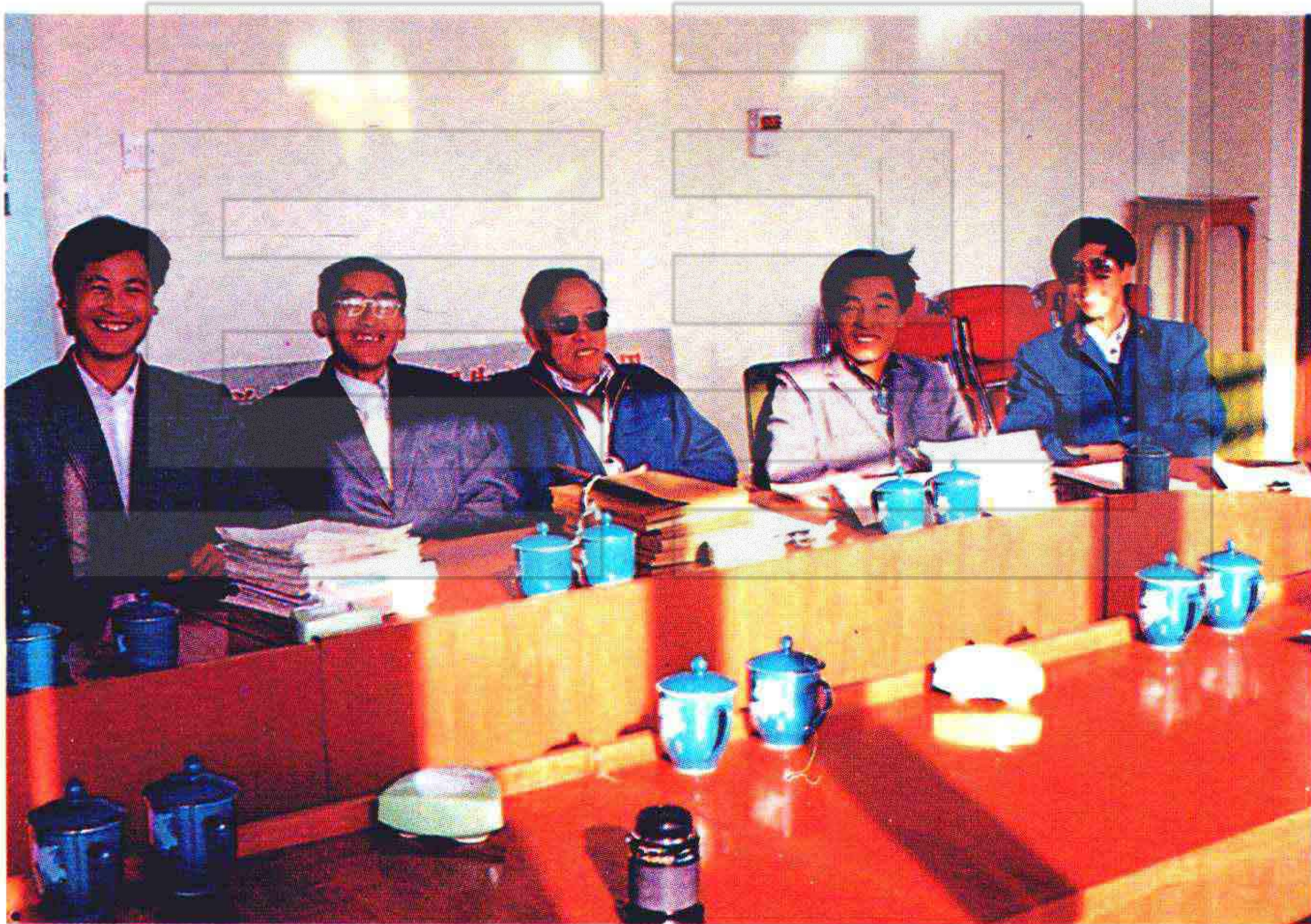
编委会部分成员在畅谈歌谣的艺术特色