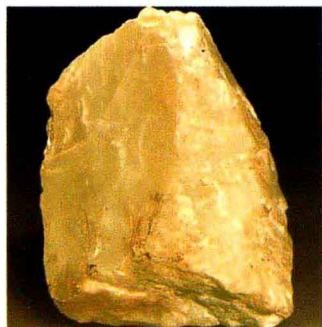
和田青白玉 / 山料

局限于玉石本身物质属性的界定，而是包含了那一时代强有力的精神内容和文化内涵在内的一种综合定义。并把这种精神的、文化的、哲学的思想系统化和理论化，正式写进国家的典章制度，约束人们的思想行为，巩固其统治。这也是中国玉文化的主要内容之一。管子曾有一段精彩的论述：“夫玉之所以贵者，九德出焉。夫玉温润以泽，仁也；邻以理者，智也；坚而不蹙，义也；廉而不刿，行也；鲜而不垢，洁也；折而不挠，勇也；瑕适皆见，精也；茂华光泽，并通而不相陵，容也；叩之，其声清搏彻远，纯而不杀，辞也。是以人主贵之，藏以为宝，剖以为符瑞，九德出焉。”其意就是温润而有光泽将玉的特性引伸到人的仁爱、博爱；表示清澈而有纹理，表示很有智慧；坚硬而不屈缩，表示一种大义；清正而不伤人，表示一种品质；鲜美而不垢污，表示一种纯洁；宁折而不屈，表示一种义勇；玉的瑕和良好的质地能通过外表看清，表示一种诚实；精美与光泽相通互融并不产生冲突，表示一