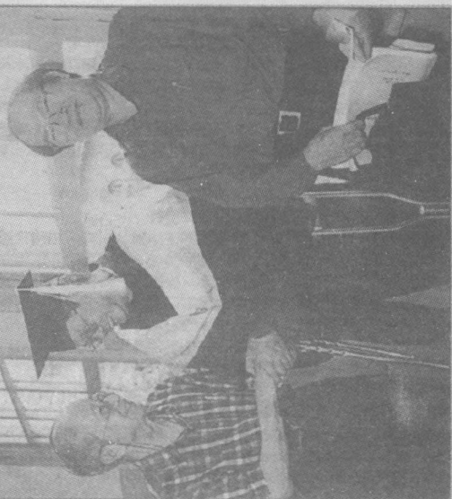
、(左)和永曹與，位士博學史歷大台得獲天昨(中)騰燦江。彩合院學文大台在(右)職承李。形攝/琳題題者記

他的歲四十五驗考在仍癌髓骨但，福祝受接杖拐著拄天昨，字萬四十六了寫文論讀半工半來年多，業畢學小有只