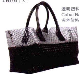
透明塑料编织黑色小羊皮 Cabat Bag (2012年新款) 参考价格：¥47000 (中) ¥60000 (大)