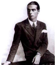
克里斯托巴尔·巴黎世家

1895年1月21日，克里斯托巴尔·巴黎世家（Cristóbal Balenciaga）生于西班牙的居塔利亚。年幼丧父的他从小便跟随母亲学习裁缝手艺，为他的事业打下坚实的基础。1916年，巴黎世家在托雷斯女侯爵的帮助下，在圣萨巴斯蒂安开设了第一家时装店。十余年后终于成为西班牙著名的服装设计师。1937年，巴黎世家离开西班牙，移居巴黎。巴黎世家潜心钻研女装设计，他常常像建筑设计家般地研究曲线的力度、结构的变化，正如他的信条——追求“建筑一样的质量”。