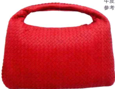
牛皮粉色超大号Veneta 参考价格：¥22000

是BV的经典包款，除小羊皮和鹿皮外，还推出了鳄鱼皮款。该系列每季都会发表不同颜色、不同皮革的系列。