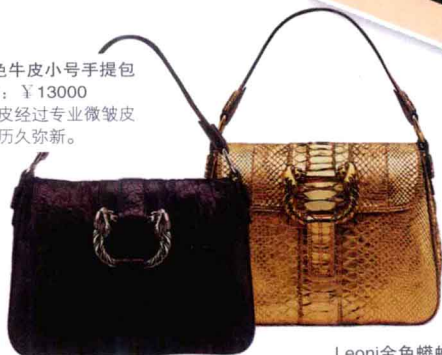
Leoni金色蟒蛇皮肩背包