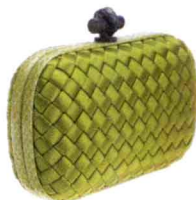
缎面编织Knot 参考价格：¥11000 水蛇皮边框让整个包体精致无比。