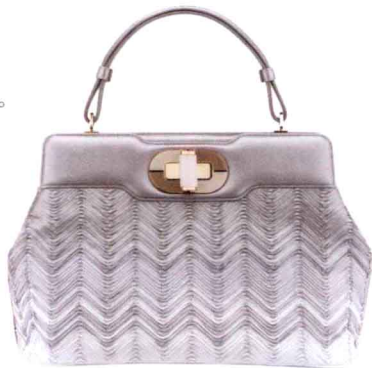
白色复古大号手提包 参考价格：¥20000 白色包身设计了独特的锯齿状浮雕，展现了细腻皮革制作工艺，镶以白色珐琅。