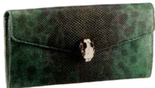
绿色蛇皮夹（2012年新款） 参考价格：¥4500 蛇头的蛇眼是由翠绿的孔雀石制成，配以同样色系的孔雀石水蛇皮，一拿出便会吸引眼球。