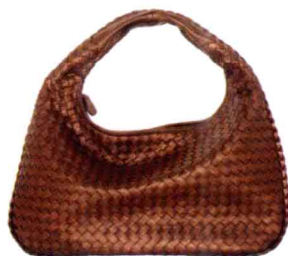
金属咖啡金小号Veneta (2012年新款) 参考价格：¥15000