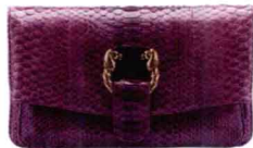
Leoni紫色蟒蛇皮晚宴包