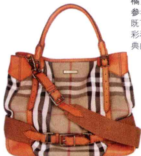
橘黄包扣格纹两用包