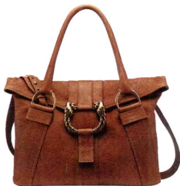
Leoni棕色羊皮中号手提包