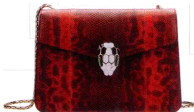
红色蛇皮中号肩背包 (2012年新款) 参考价格：¥15000 耀眼夺目，配以华贵精致的蛇头包扣，狂野而性感。 (尺寸：小20cm×3.5cm×15cm，中30cm×12cm×22cm)