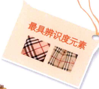
经典格纹多包扣手提包 (2012年新款)