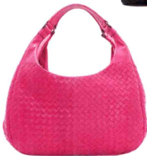
桃红Campana (2012年新款) 参考价格：¥22000