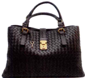
黑色羊皮Roma 参考价格：¥28000