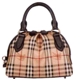
马术格纹复古两用背包 (2012年新款)