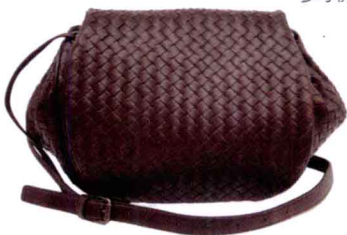
咖啡色羊皮Shoulder 参考价格：¥16000