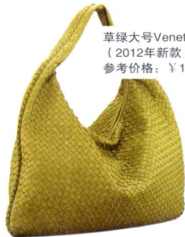
草绿大号Veneta (2012年新款) 参考价格：¥19000