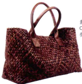
多种棕色编织小羊皮 Cabat Bag (2012年新款) 参考价格：¥47000 (中) ¥60000 (大)