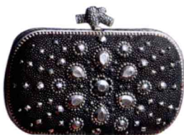
限量版装饰Knot 无论金属装饰，还是包扣、包身的皮革，都极尽工艺，是艺术品。