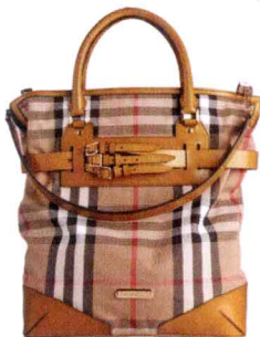
芥木黄两用背包 (2012年新款)