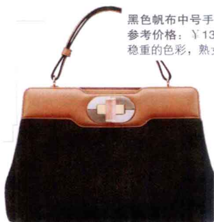
黑色帆布中号手提包 参考价格：¥13000 稳重的色彩，熟女的性感。

包包典雅成熟，中央包扣是珍贵宝石，是整个包包最有门道的地方。 (尺寸：中32cm×14cm×22cm，大34.5cm×17.5cm×26cm)