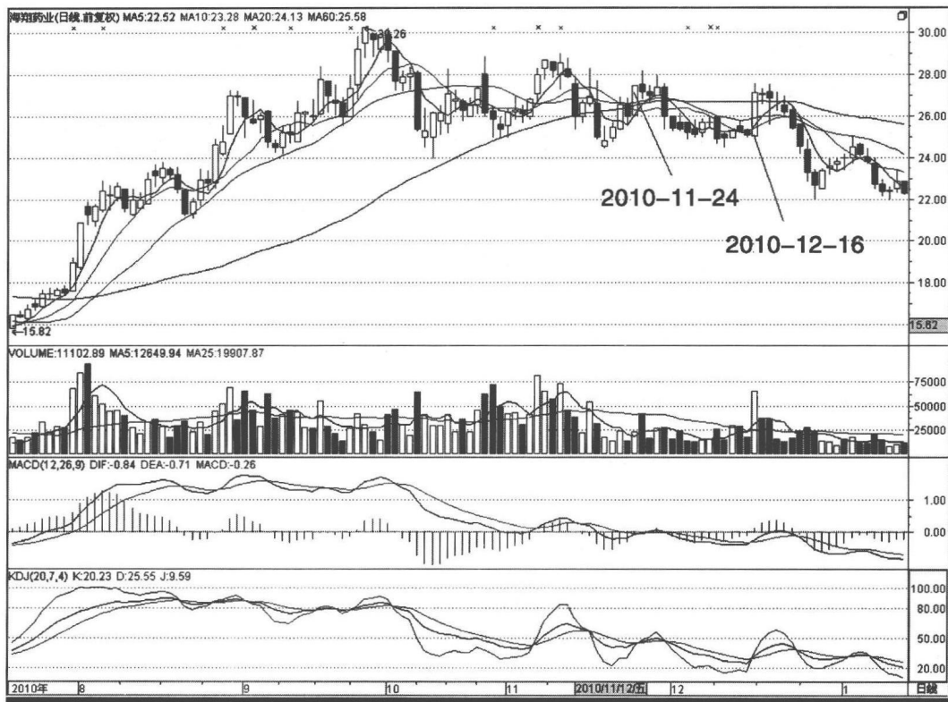
图 1-3 海翔药业 002099

浪比一浪高的上升趋势，右边则是一浪比一浪低的下跌趋势，这是很清楚明了的。也许你要说：“后面没发生的时候我怎么判定？事后诸葛亮谁不会！”这话在理。但是如果股价运行到2010年11月24日你还不知道走势已经呈现下跌趋势，那只能说明你对趋势的感觉比较麻木。后期的每一浪反弹都没欲望去挑战一下前高，就已经说明多头的孱弱。当反弹的高点一个比一个低的时候，我们就应该感觉下跌趋势正在形成。只是炒股的人多在心理上偏向美好的一面，以至于总认为调整之后还会有更大的涨幅，这种心理害死了不少人。