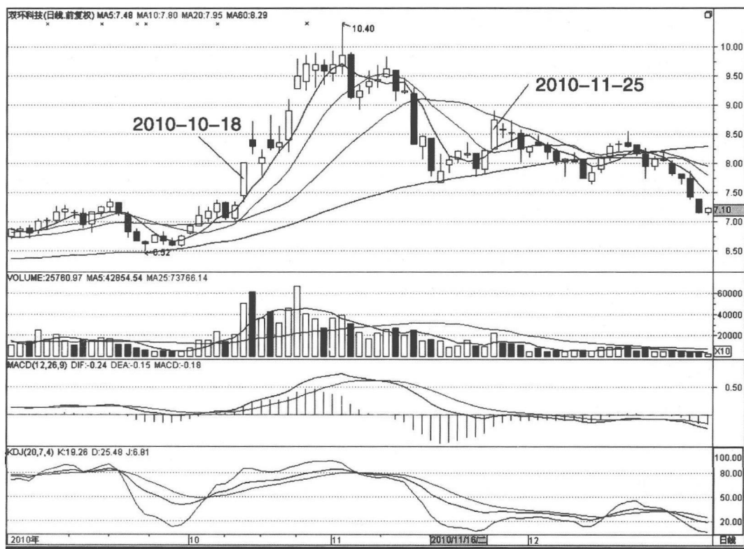
图 1-1 双环科技 000707

如图 1-1 所示，2010 年 10 月 18 日双环科技收出一根大阳线，当日涨