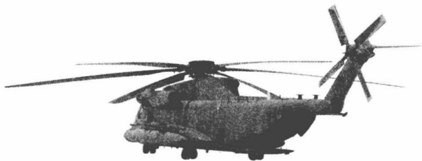
旋风变形的直升机

虽然不明飞行器仍然没有表明身份,但却开始着陆了。“猛禽一号”的飞行员驱机紧随其后,并再次呼叫瞭望塔。“它正在降落,”飞行员说道,“尾翼代码是 4500X-ray。”