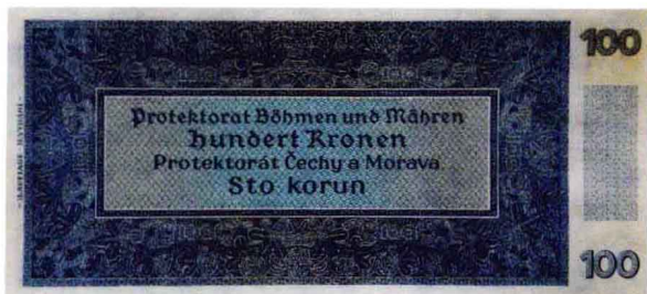
波希米亚1940年100克朗样票（背面）