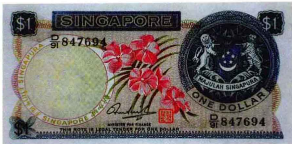
新加坡第一枚纸币

对多数收藏者来说，投资增值是收藏投资的主要目的。但真正的收藏家则认为，收藏图案丰富的纸币是对科学艺术的享受，也是了解世界各国人文历史知识的窗口，更是开阔视野、升华精神的途径。