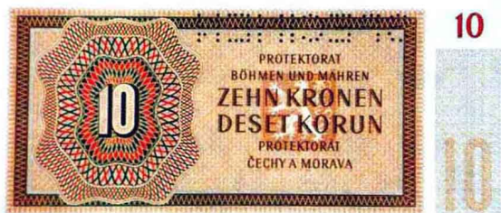
波希米亚1942年10克朗样票(背面)