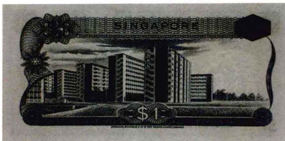
新加坡第一枚纸币（背面）