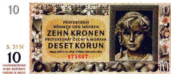
波希米亚1942年10克朗样票

相对于五花八门的邮票，纸币上图案的主题在某些方面受到的限制很大。作为一个国家的名片，纸币的形象设计不得不考虑其严肃性和权威性，国家的政治制度、文明程度和价值取向。货币的设计者和决策者的风格倾向也对纸币内容起到决定作用。