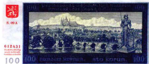
波希米亚1940年100克朗样票