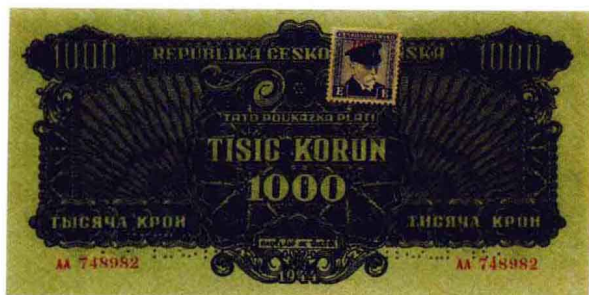
捷克斯洛伐克1944年1000克朗样票（加贴票）