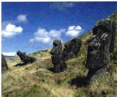
复活节岛未完成的雕像

更神秘的是岛上的石像。这些石像又高又重，最高的达到12米，最重的有90吨。12米相当于4层楼高，90吨相当于500个大人加起来的重量。你想想，要把500